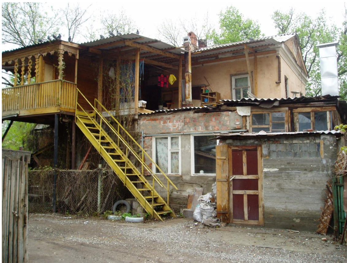
«Дом жилой», 2-я пол. XIX в., до 1884 г., – г. Астрахань, ул. Свердлова, 49, ул. Шелгунова, 3. Фото № 6. Вид на дворовый юго-восточный фасад (Лит. «А»).