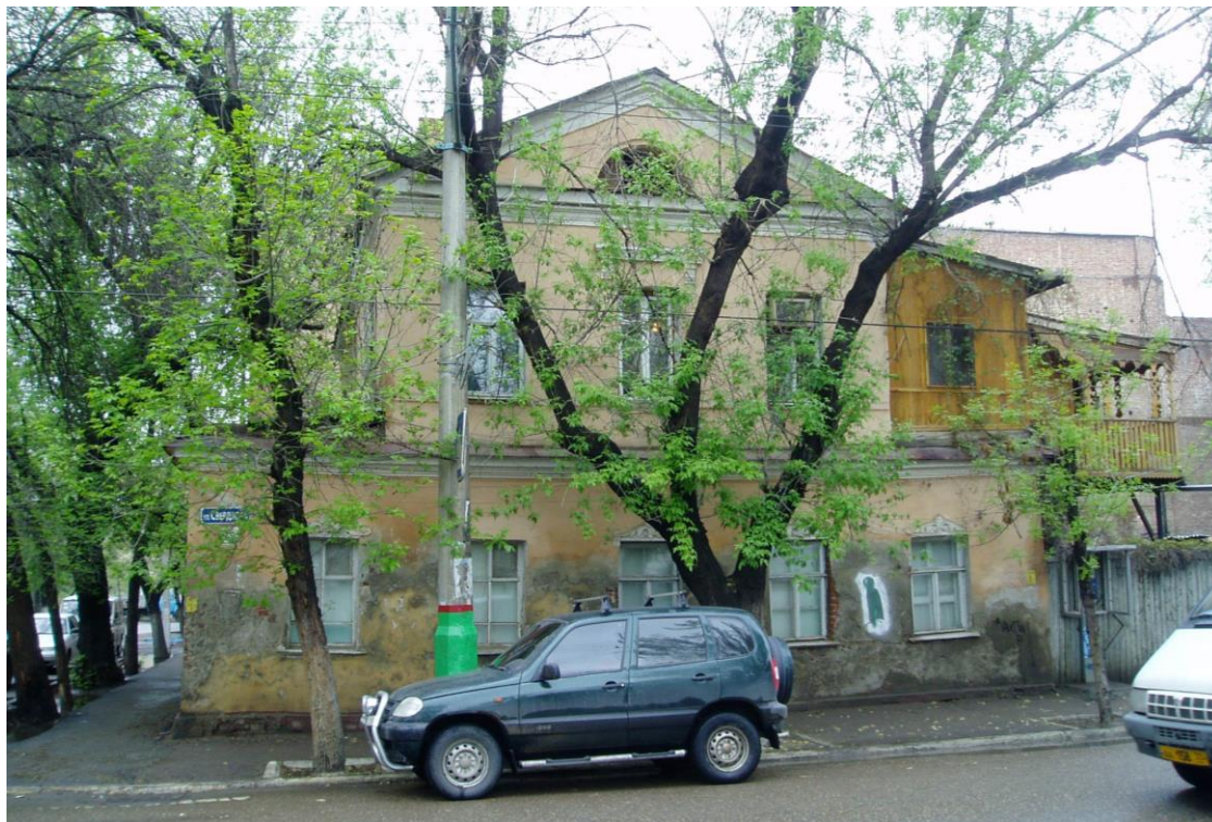
«Дом жилой», 2-я пол. XIX в., до 1884 г., – г. Астрахань, ул. Свердлова, 49, ул. Шелгунова, 3. Фото № 1. Главный юго-западный фасад (ул. Свердлова, 49, лит. «А»).