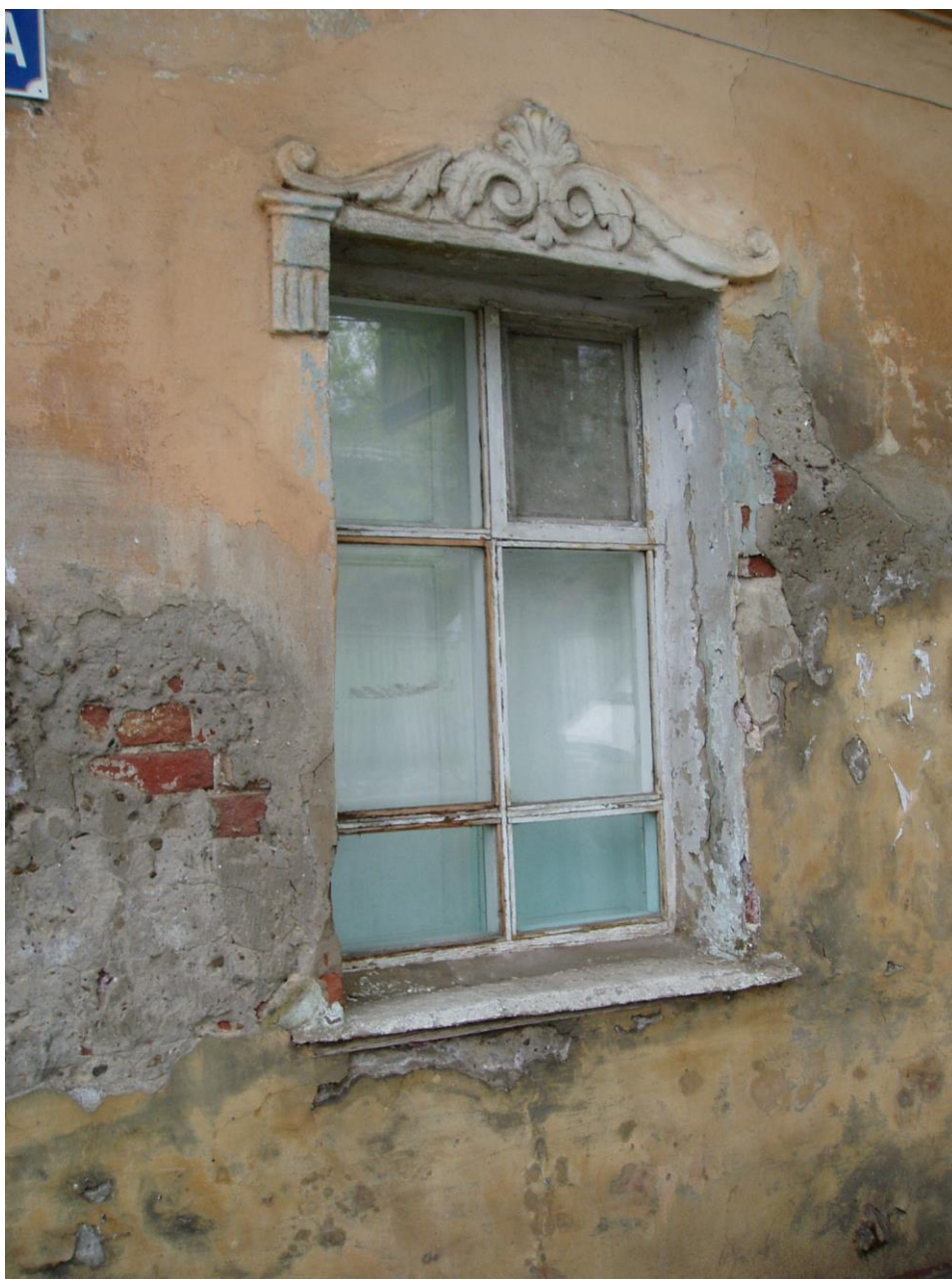
«Дом жилой», 2-я пол. XIX в., до 1884 г., – г. Астрахань, ул. Свердлова, 49, ул. Шелгунова, 3. Фото № 5. Декоративное оформление окон 1-го этажа (ул. Свердлова, 49, лит. «А»).