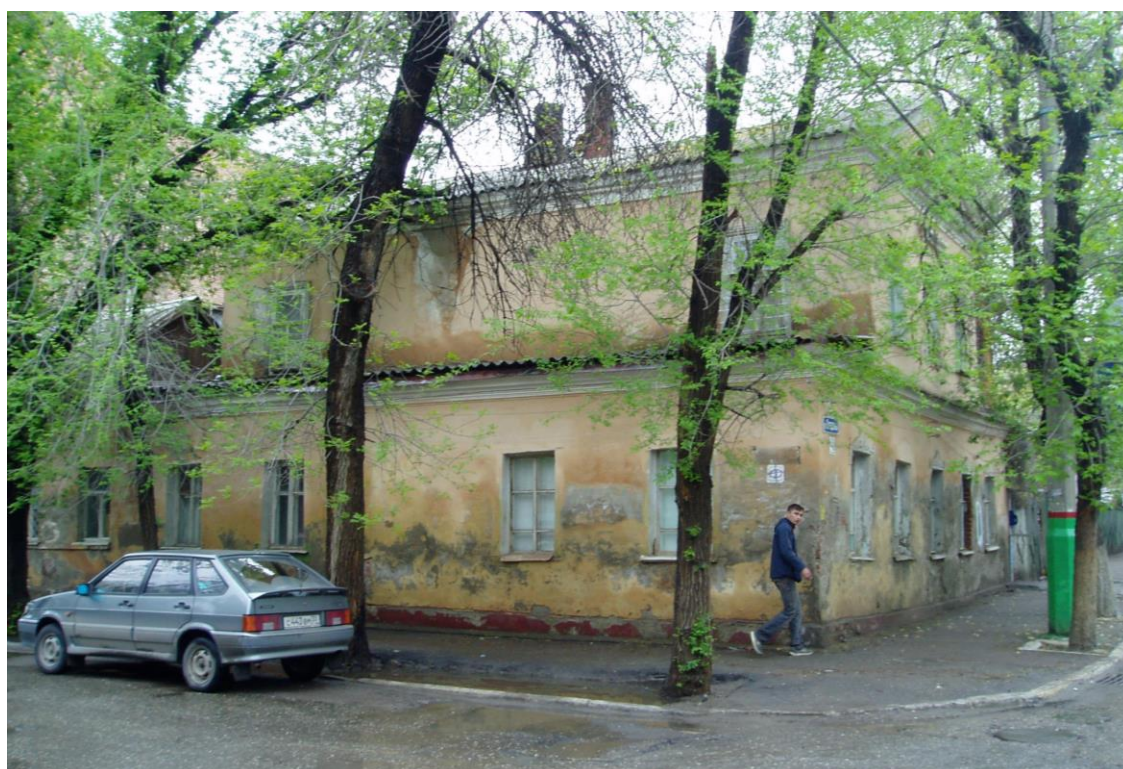
«Дом жилой», 2-я пол. XIX в., до 1884 г., – г. Астрахань, ул. Свердлова, 49, ул. Шелгунова, 3. Фото № 2. Правая часть главного северо-западного фасада (ул. Шелгунова, 3, лит. «А»).