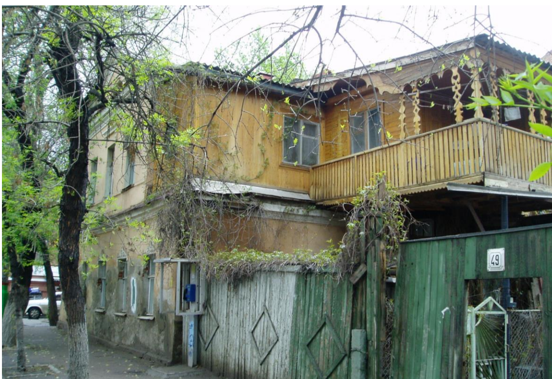
«Дом жилой», 2-я пол. XIX в., до 1884 г., – г. Астрахань, ул. Свердлова, 49, ул. Шелгунова, 3. Фото № 4. Вид на здание с востока (ул. Свердлова, 49, лит. «А»)). Май 2022 г.