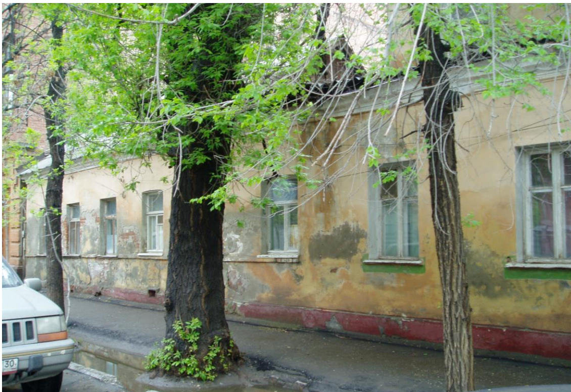
«Дом жилой», 2-я пол. XIX в., до 1884 г., – г. Астрахань, ул. Свердлова, 49, ул. Шелгунова, 3. Фото № 3. Левая часть главного северо-западного фасада (ул. Шелгунова, 3, лит. «А»)). Май 2022 г.