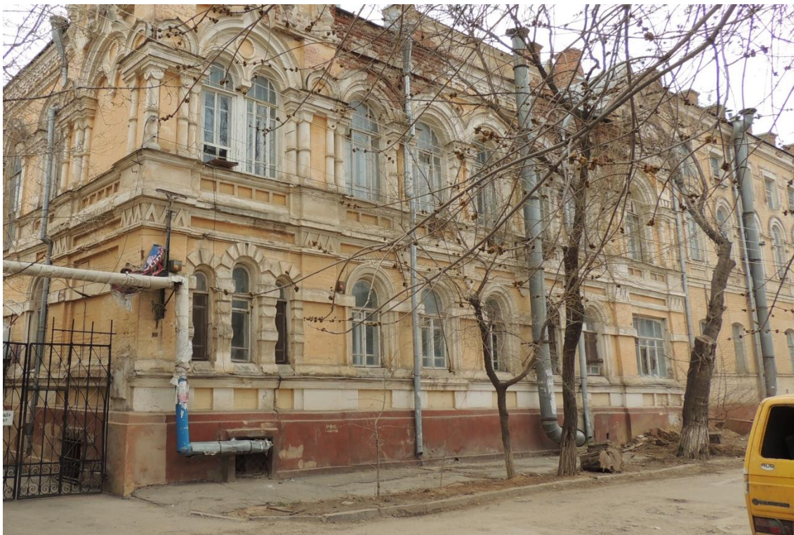
«Комплекс больничный российского общества «Красный Крест», кон. 19 – нач. 20 вв.» – г. Астрахань, ул. Мечникова, 25, ул. Гилянская, 40, 42, ул. Лычманова, 41, 43. Фото № 13. Фрагмент главного северного фасада здания лит. «Г» (ул. Гилянская). Восточная часть фасада. Фото Горловой Л.К., март 2023 г.