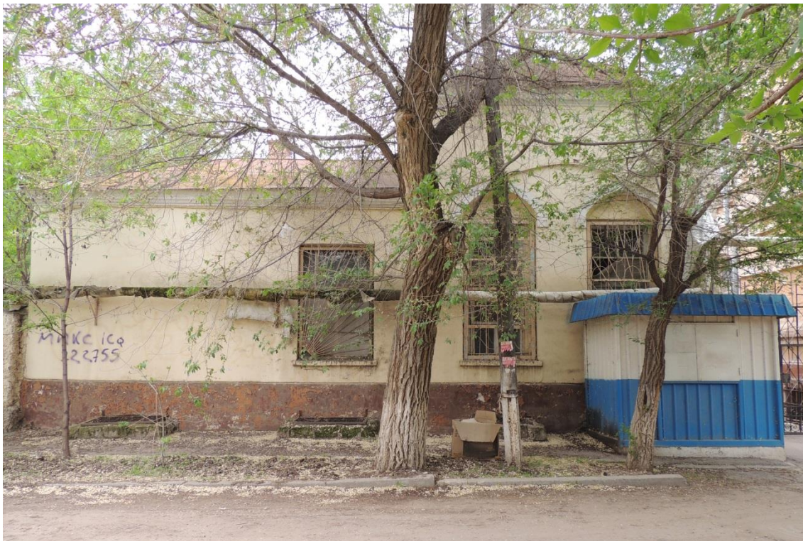
«Комплекс больничный российского общества «Красный Крест», кон. 19 – нач. 20 вв.» – г. Астрахань, ул. Мечникова, 25, ул. Гилянская, 40, 42, ул. Лычманова, 41, 43.

Фото № 17. Главный северный фасад здания лит. «Д» (ул. Гилянская).