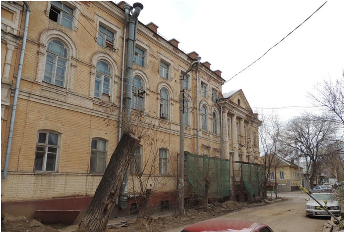
«Комплекс больничный российского общества «Красный Крест», кон. 19 – нач. 20 вв.» – г. Астрахань, ул. Мечникова, 25, ул. Гилянская, 40, 42, ул. Лычманова, 41, 43. Фото № 12. Фрагмент главного северного фасада здания лит. «Г» (ул. Гилянская). Западная часть фасада. Фото Горловой Л.К., март 2023 г.