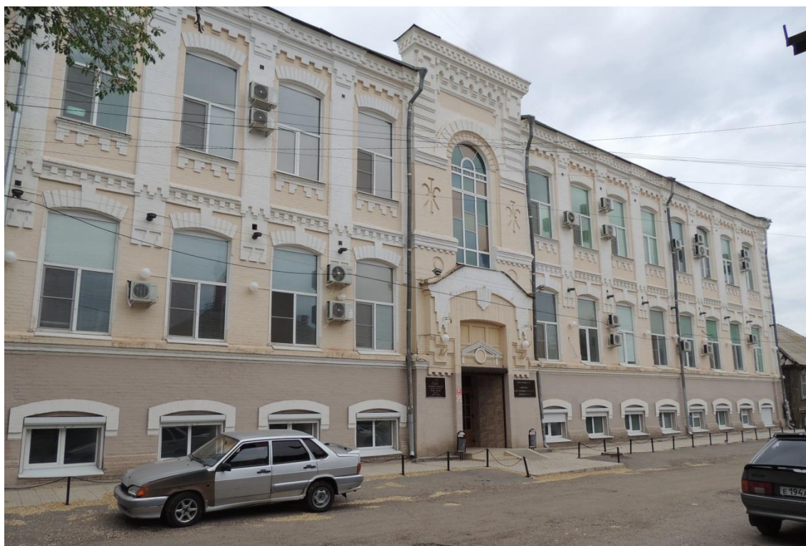
«Комплекс больничный российского общества «Красный Крест», кон. 19 – нач. 20 вв.» – г. Астрахань, ул. Мечникова, 25, ул. Гилянская, 40, 42, ул. Лычманова, 41, 43. Фото № 2. Вид с запада на главный южный фасад здания лит. «А» (ул. Лычманова). май 2023 г.