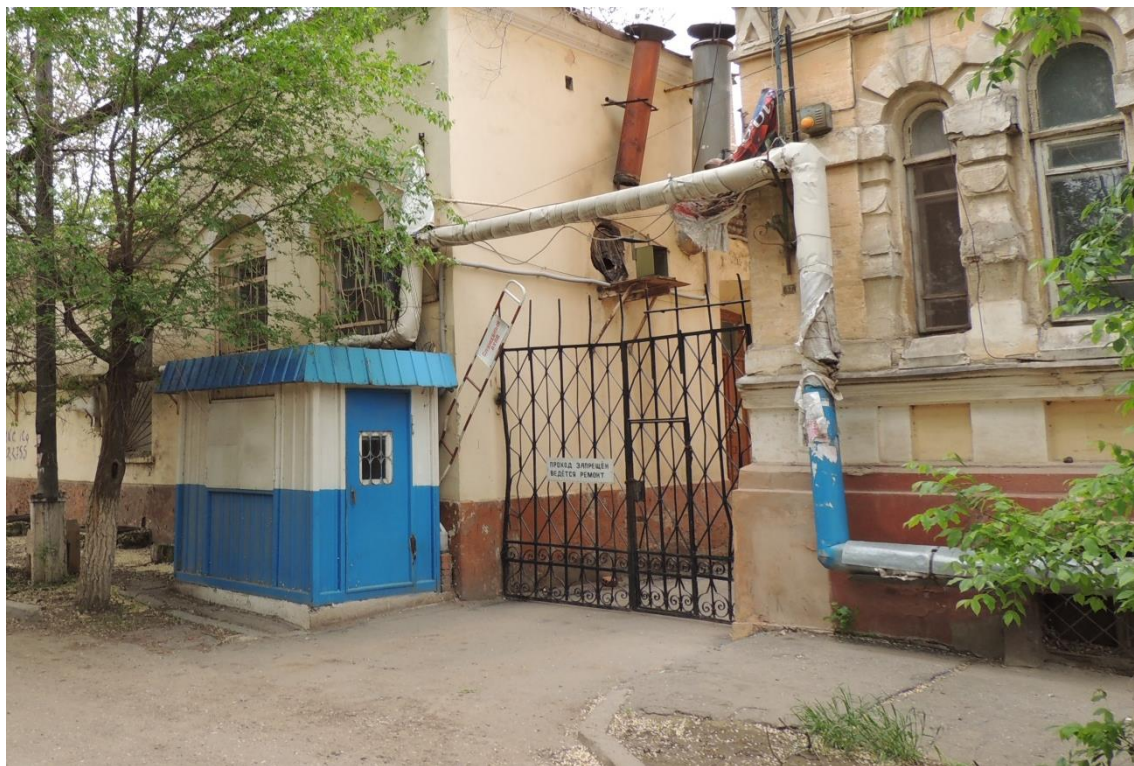
«Комплекс больничный российского общества «Красный Крест», кон. 19 – нач. 20 вв.» – г. Астрахань, ул. Мечникова, 25, ул. Гилянская, 40, 42, ул. Лычманова, 41, 43.

Фото № 22. Вид на проездные ворота, поставленные по ул. Гилянская между зданиями лит. «Г» и лит. «Д».