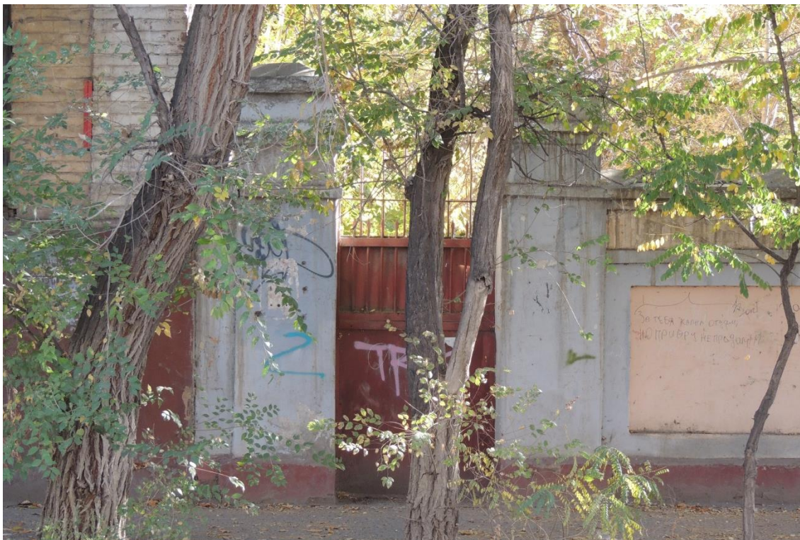
«Комплекс больничный российского общества «Красный Крест», кон. 19 – нач. 20 вв.» – г. Астрахань, ул. Мечникова, 25, ул. Гилянская, 40, 42, ул. Лычманова, 41, 43. Фото № 23. Металлическая калитка, устроенная в ограде по ул. Мечникова к югу от лит. «Г». Фото Горловой Л.К., октябрь 2022 г.