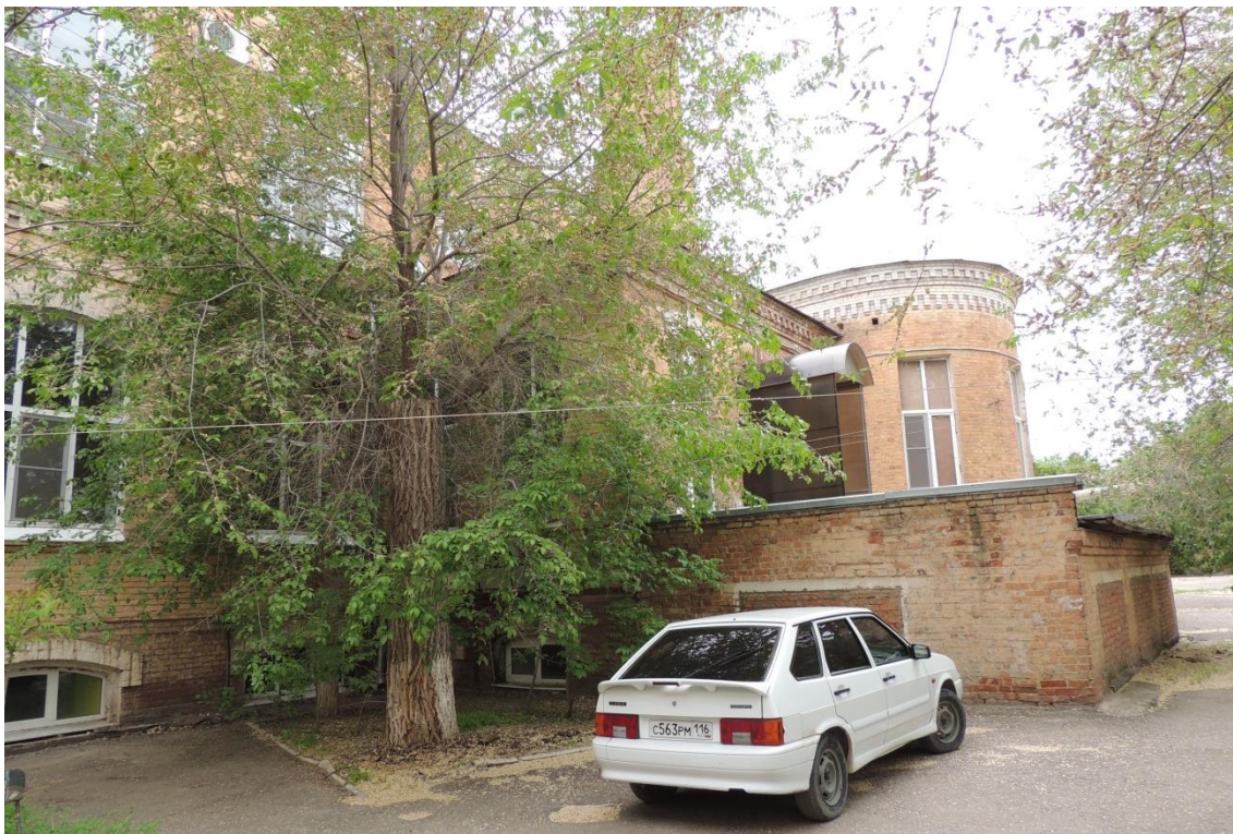
«Комплекс больничный российского общества «Красный Крест», кон. 19 – нач. 20 вв.» – г. Астрахань, ул. Мечникова, 25, ул. Гилянская, 40, 42, ул. Лычманова, 41, 43. Фото № 5. Фрагмент северного дворового фасада здания лит. «А» (правая часть). Фото Горловой Л.К., май 2023 г.