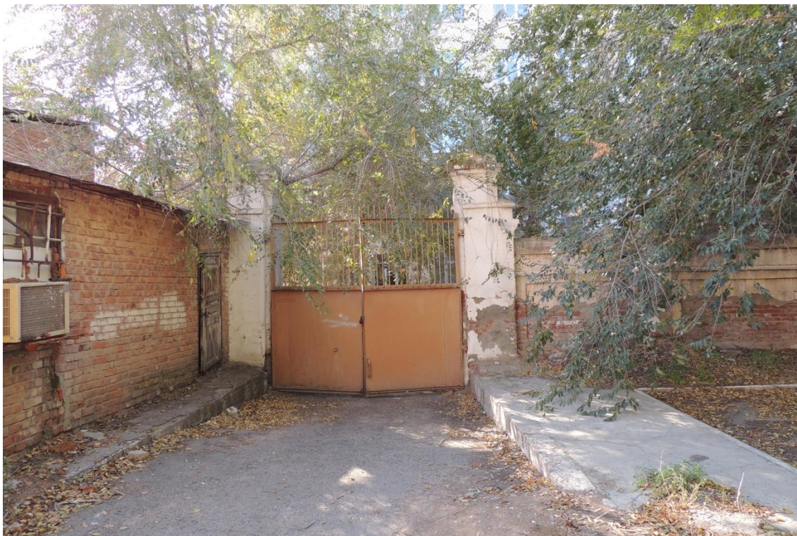
«Комплекс больничный российского общества «Красный Крест», кон. 19 – нач. 20 вв.» – г. Астрахань, ул. Мечникова, 25, ул. Гилянская, 40, 42, ул. Лычманова, 41, 43.

Фото № 21. Вид на проездные ворота, поставленные по ул. Лычманова с западной стороны лит. «Ф».