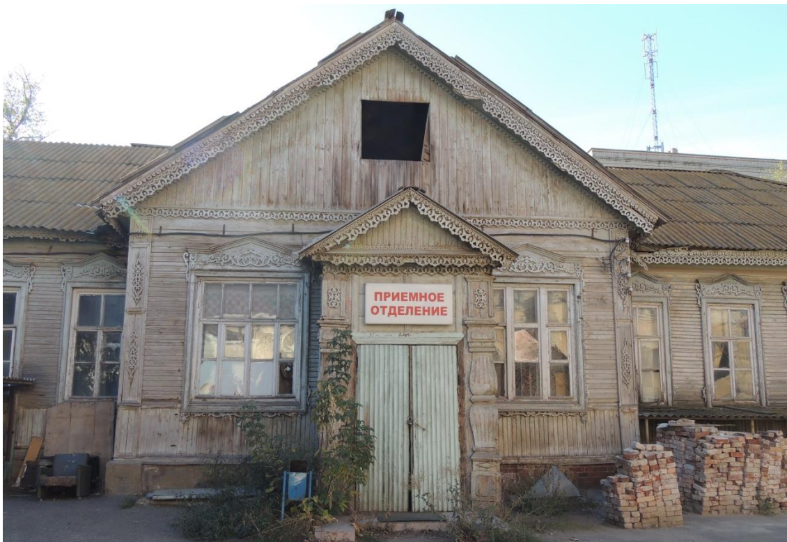
«Комплекс больничный российского общества «Красный Крест», кон. 19 – нач. 20 вв.» – г. Астрахань, ул. Мечникова, 25, ул. Гилянская, 40, 42, ул. Лычманова, 41, 43.

Фото № 10. Фрагмент дворового северного фасада здания лит. «Б».