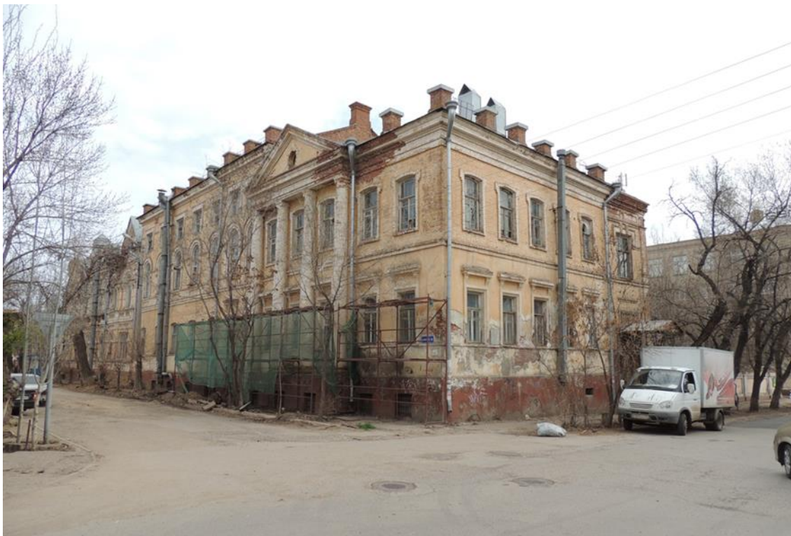
«Комплекс больничный российского общества «Красный Крест», кон. 19 – нач. 20 вв.» – г. Астрахань, ул. Мечникова, 25, ул. Гилянская, 40, 42, ул. Лычманова, 41, 43. Фото № 11. Общий вид здания лит. «Г» с перекрёстка ул. Гилянская и ул. Мечникова. март 2023 г.