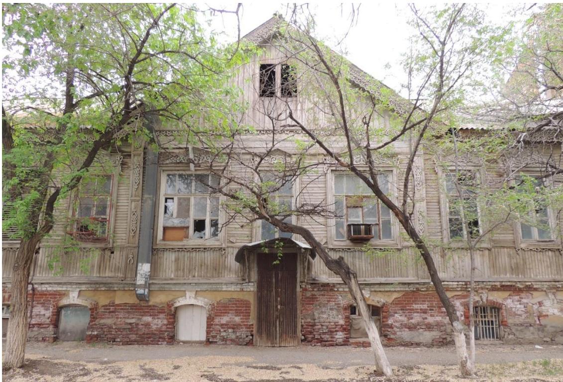
«Комплекс больничный российского общества «Красный Крест», кон. 19 – нач. 20 вв.» – г. Астрахань, ул. Мечникова, 25, ул. Гилянская, 40, 42, ул. Лычманова, 41, 43.

Фото № 8. Центральная часть главного южного фасада здания лит. «Б» (ул. Лычманова).