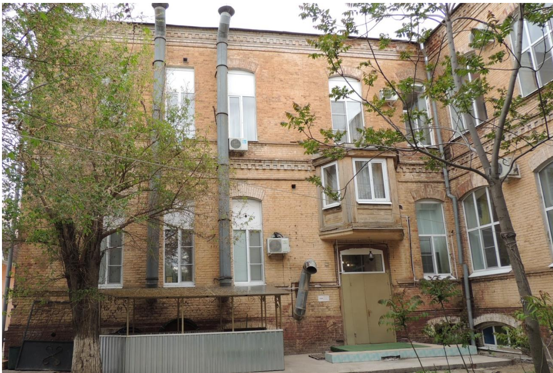
«Комплекс больничный российского общества «Красный Крест», кон. 19 – нач. 20 вв.» – г. Астрахань, ул. Мечникова, 25, ул. Гилянская, 40, 42, ул. Лычманова, 41, 43. Фото № 3. Западный дворовый фасад здания лит. «А». Фото Горловой Л.К., май 2023 г.