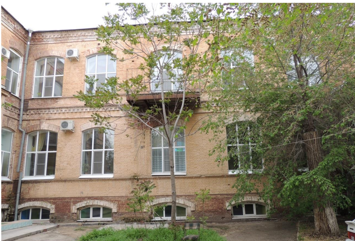
«Комплекс больничный российского общества «Красный Крест», кон. 19 – нач. 20 вв.» – г. Астрахань, ул. Мечникова, 25, ул. Гилянская, 40, 42, ул. Лычманова, 41, 43. Фото № 4. Фрагмент северного дворового фасада здания лит. «А» (левая часть). май 2023 г.