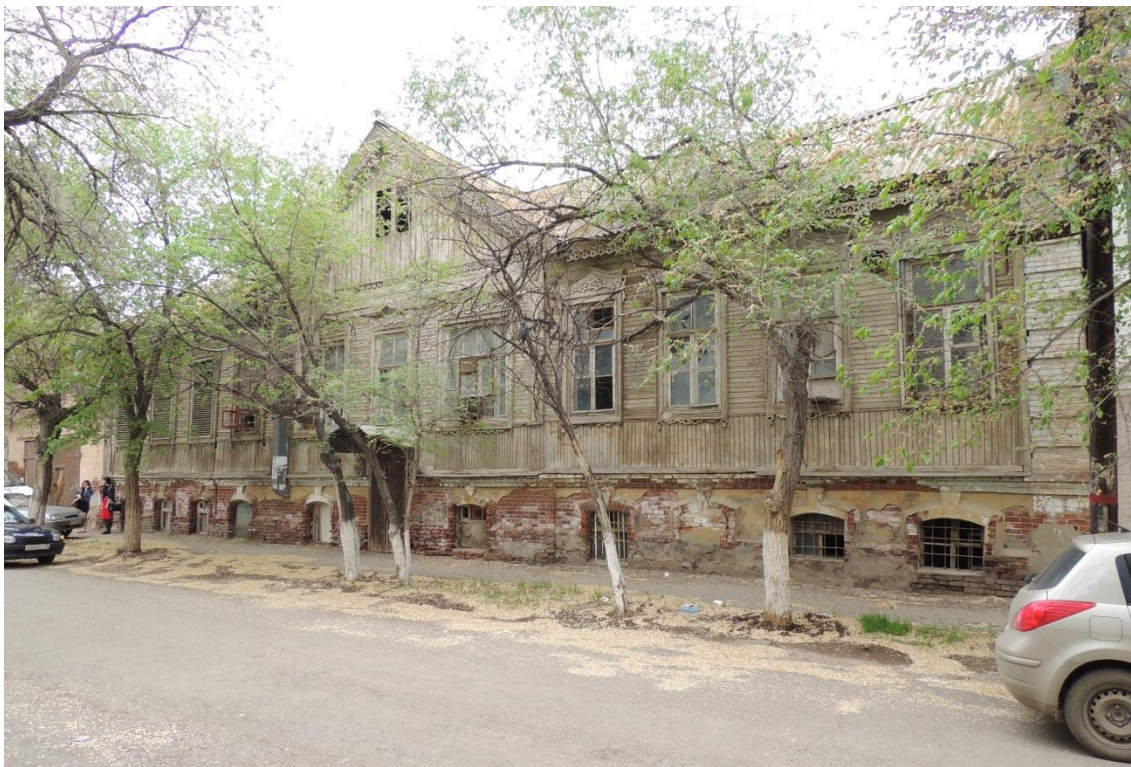
«Комплекс больничный российского общества «Красный Крест», кон. 19 – нач. 20 вв.» – г. Астрахань, ул. Мечникова, 25, ул. Гилянская, 40, 42, ул. Лычманова, 41, 43.

Фото № 7. Главный южный фасад здания лит. «Б» (ул. Лычманова).