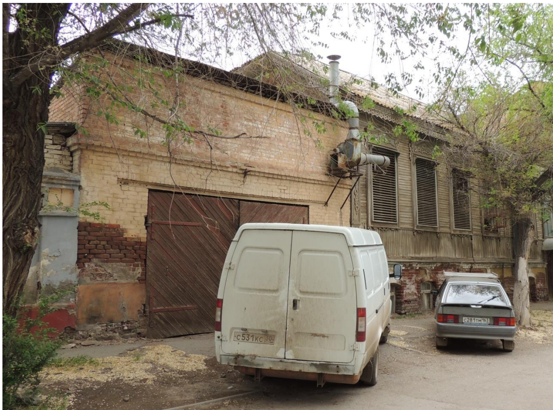
«Комплекс больничный российского общества «Красный Крест», кон. 19 – нач. 20 вв.» – г. Астрахань, ул. Мечникова, 25, ул. Гилянская, 40, 42, ул. Лычманова, 41, 43.

Фото № 19. Южный фасад строения лит. «Э» (гараж, ул. Лычманова).