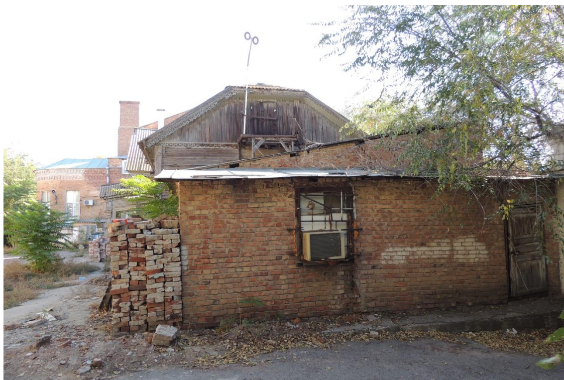
«Комплекс больничный российского общества «Красный Крест», кон. 19 – нач. 20 вв.» – г. Астрахань, ул. Мечникова, 25, ул. Гилянская, 40, 42, ул. Лычманова, 41, 43.

Фото № 20. Западный фасад строения лит. «Ф» (хозяйственная постройка).