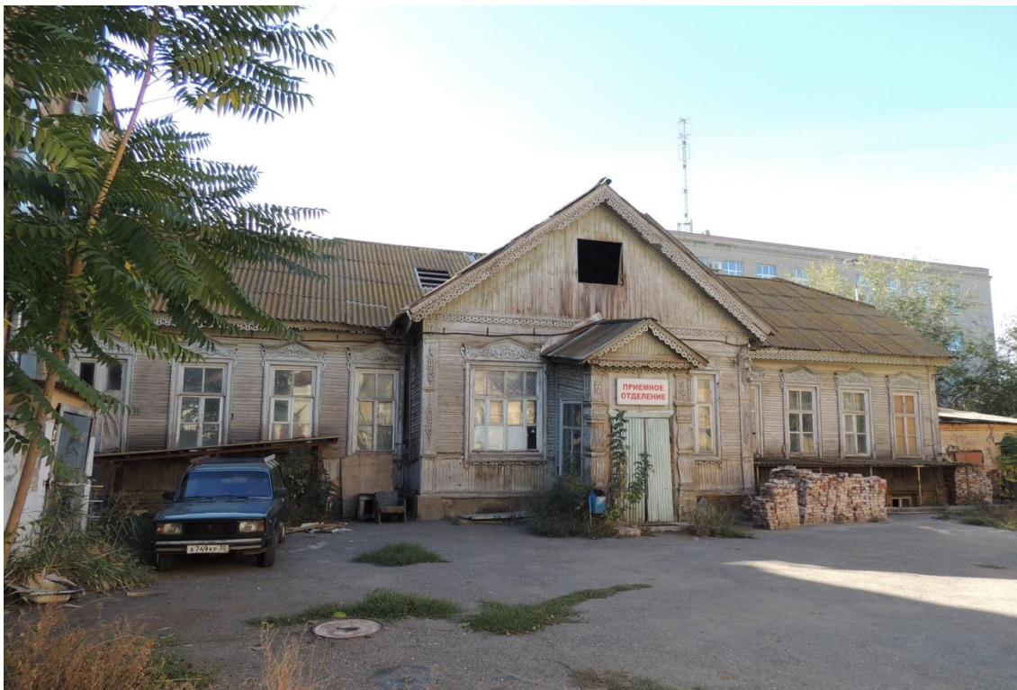
«Комплекс больничный российского общества «Красный Крест», кон. 19 – нач. 20 вв.» – г. Астрахань, ул. Мечникова, 25, ул. Гилянская, 40, 42, ул. Лычманова, 41, 43.

Фото № 9. Дворовый северный фасад здания лит. «Б».