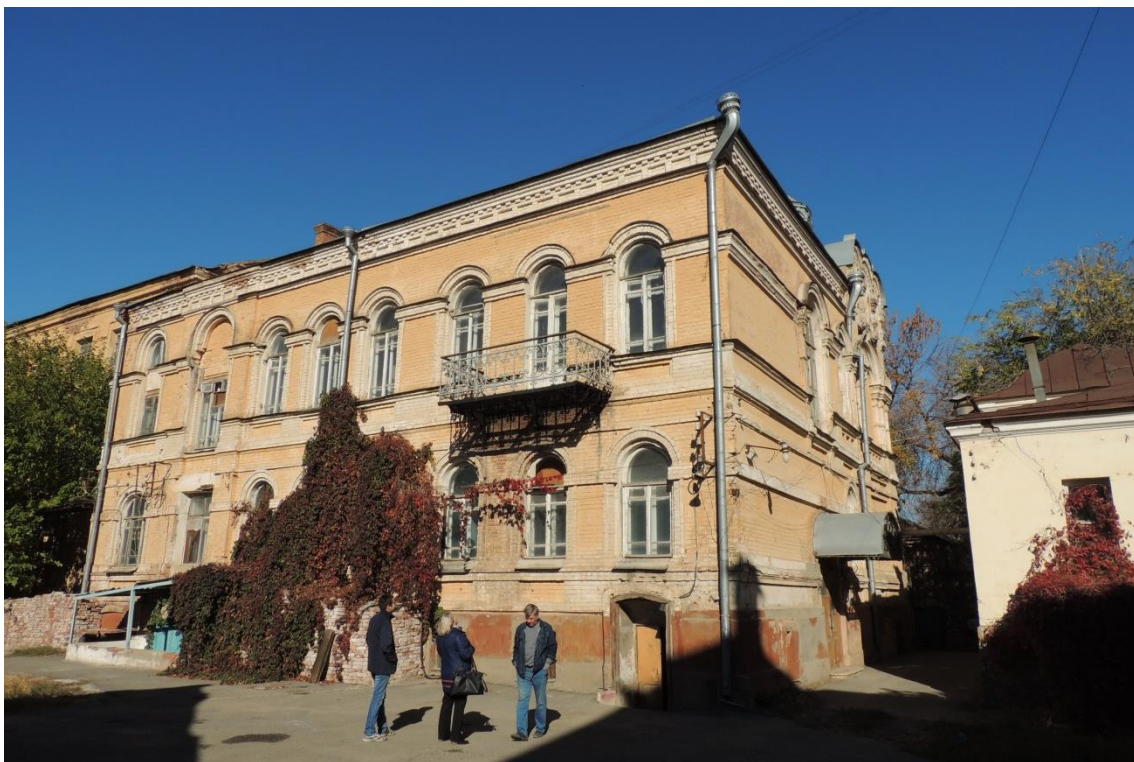
«Комплекс больничный российского общества «Красный Крест», кон. 19 – нач. 20 вв.» – г. Астрахань, ул. Мечникова, 25, ул. Гилянская, 40, 42, ул. Лычманова, 41, 43.

Фото № 16. Фрагмент дворового южного фасада здания лит. «Г».