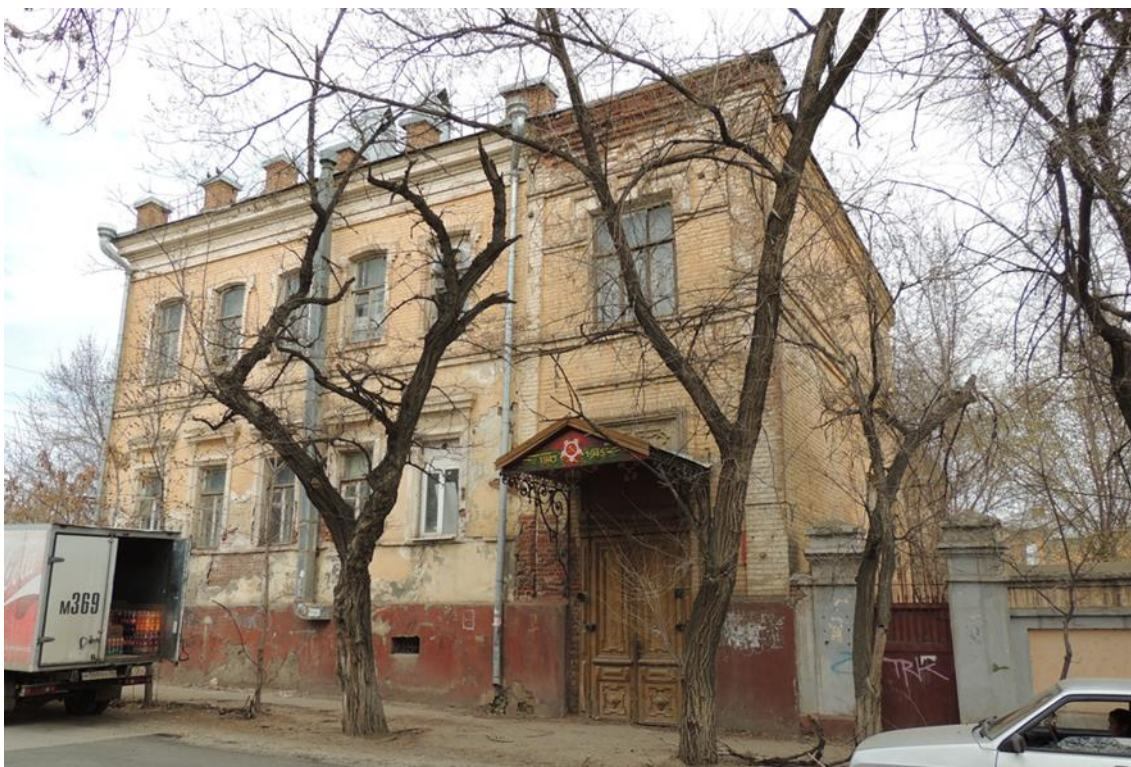
«Комплекс больничный российского общества «Красный Крест», кон. 19 – нач. 20 вв.» – г. Астрахань, ул. Мечникова, 25, ул. Гилянская, 40, 42, ул. Лычманова, 41, 43. Фото № 14. Главный западный фасад здания лит. «Г» (ул. Мечникова). март 2023 г.