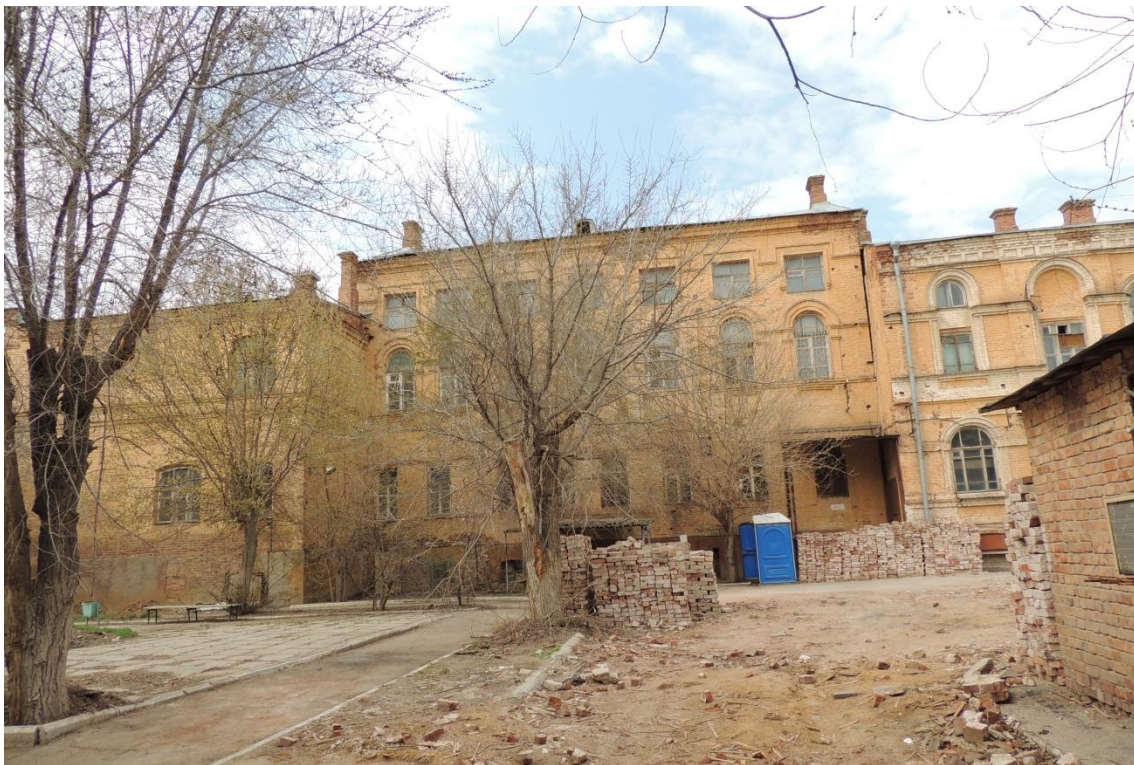
«Комплекс больничный российского общества «Красный Крест», кон. 19 – нач. 20 вв.» – г. Астрахань, ул. Мечникова, 25, ул. Гилянская, 40, 42, ул. Лычманова, 41, 43.

Фото № 15. Фрагмент дворового южного фасада здания лит. «Г».