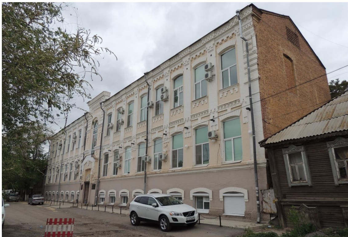
«Комплекс больничный российского общества «Красный Крест», кон. 19 – нач. 20 вв.» – г. Астрахань, ул. Мечникова, 25, ул. Гилянская, 40, 42, ул. Лычманова, 41, 43. Фото № 1. Вид с востока на главный южный фасад здания лит. «А» (ул. Лычманова). Фото Горловой Л.К., май 2023 г.