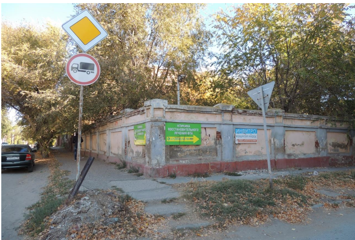
«Комплекс больничный российского общества «Красный Крест», кон. 19 – нач. 20 вв.» – г. Астрахань, ул. Мечникова, 25, ул. Гилянская, 40, 42, ул. Лычманова, 41, 43. Фото № 24. Кирпичная ограда на столбах с глухим заполнением, возведена по ул. Мечникова и ул. Лычманова Фото Горловой Л.К., октябрь 2022 г.