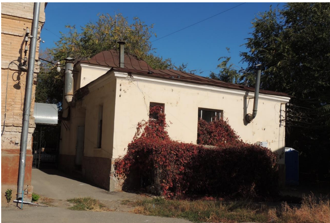
«Комплекс больничный российского общества «Красный Крест», кон. 19 – нач. 20 вв.» – г. Астрахань, ул. Мечникова, 25, ул. Гилянская, 40, 42, ул. Лычманова, 41, 43.

Фото № 18. Вид на дворовые фасады (западный и южный) здания лит. «Д».