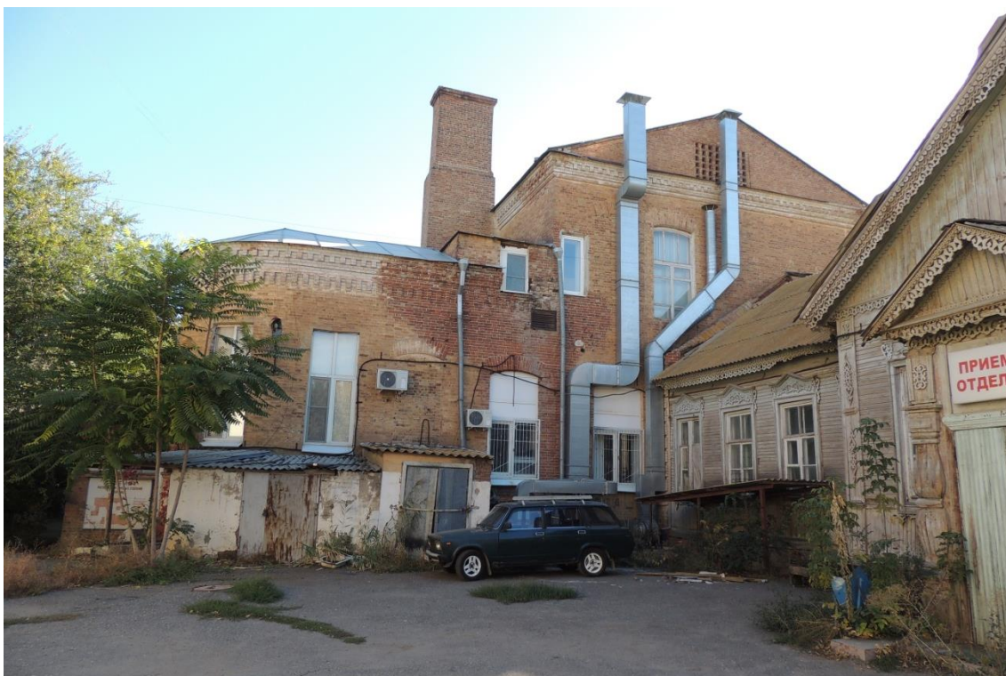
«Комплекс больничный российского общества «Красный Крест», кон. 19 – нач. 20 вв.» – г. Астрахань, ул. Мечникова, 25, ул. Гилянская, 40, 42, ул. Лычманова, 41, 43. Фото № 6. Западный дворовый фасад здания лит. «А». Фото Горловой Л.К., октябрь 2022 г.