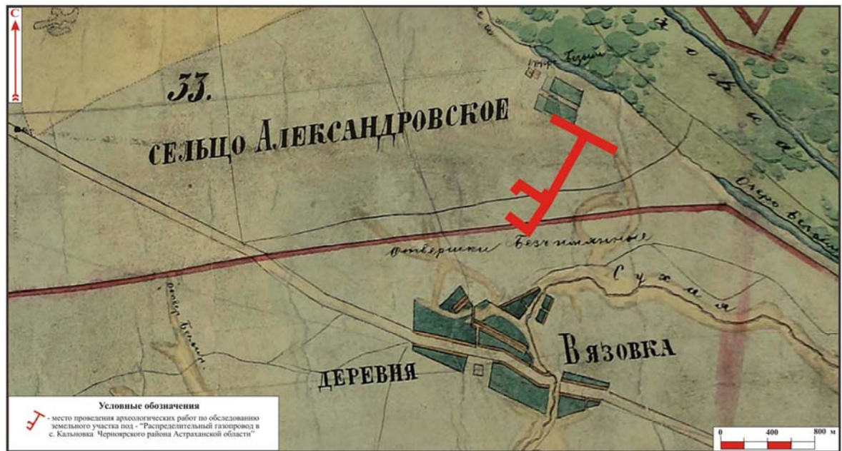
Илл. 5. Расположение земельного участка, отводимого под - «Распределительный газопровод в селе Калыновка Черноярского района Астраханской области», подлежащего археологическому обследованию, на «Плане Генерального межевания Царицынского уезда 1815-1840 годов».