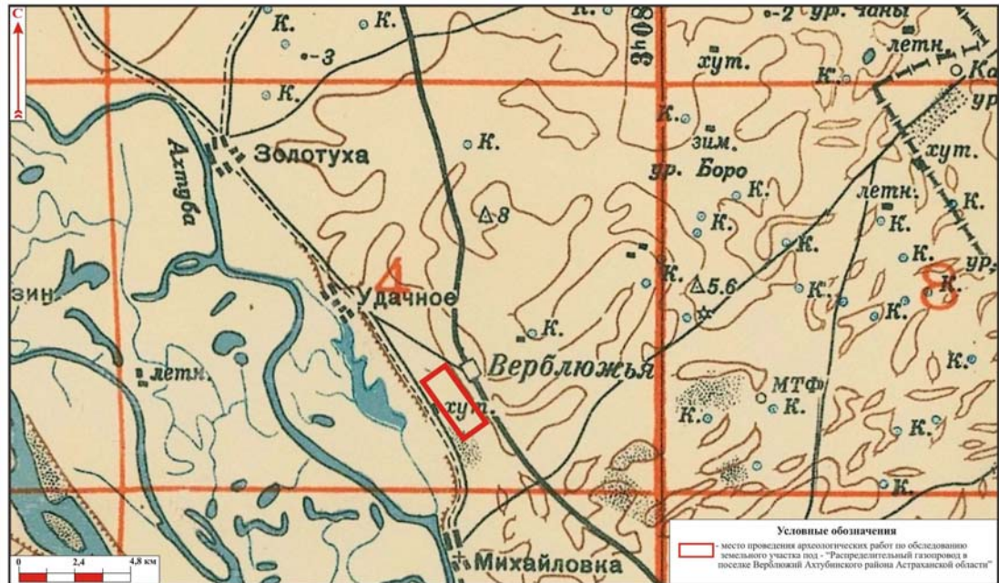
Илл. 7. Расположение земельного участка, отводимого под «Распределительный газопровод в поселке Верблюжий Ахтубинского района Астраханской области», подлежащего археологическому обследованию, на «Топографической военной карте РККА 1932-1942 годов» (источник – сайт – etomesto.ru. Дата обращения - 10.08.2023).