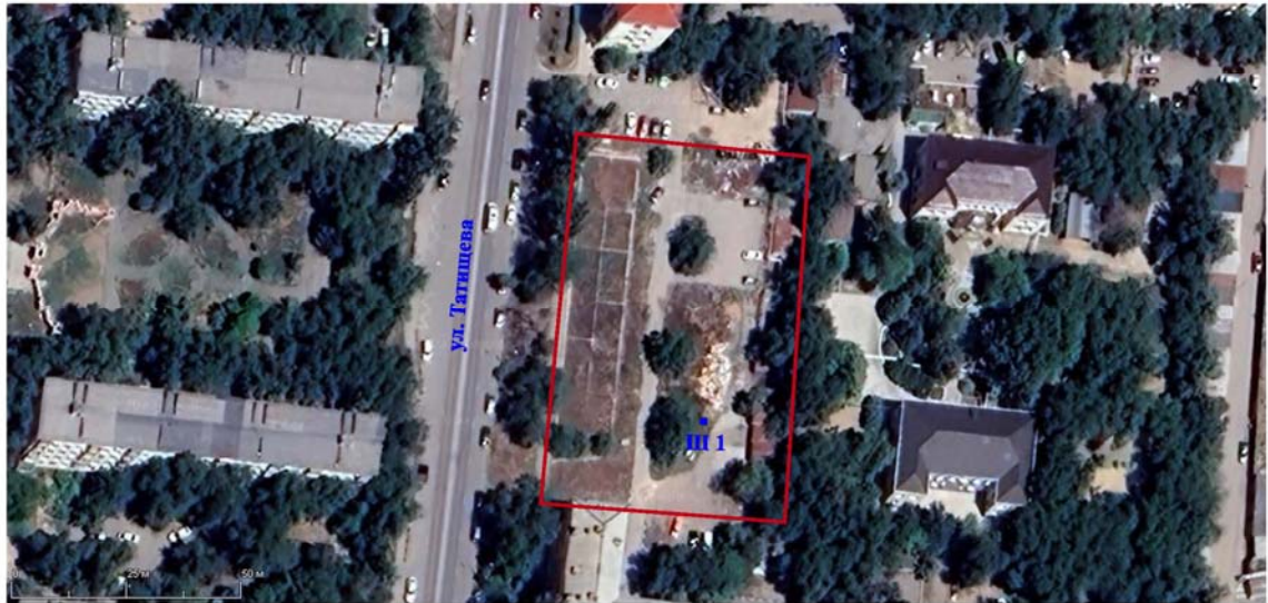
■ Ш 1 - шурф

Рис. 3. Снимок со спутника («Bing maps», сборка от 12.07.2021 г.) участка с кадастровым номером 30:12:020309:4 в Ленинском районе города Астрахани с указанием места расположения объекта археологического обследования и разведочного шурфа.