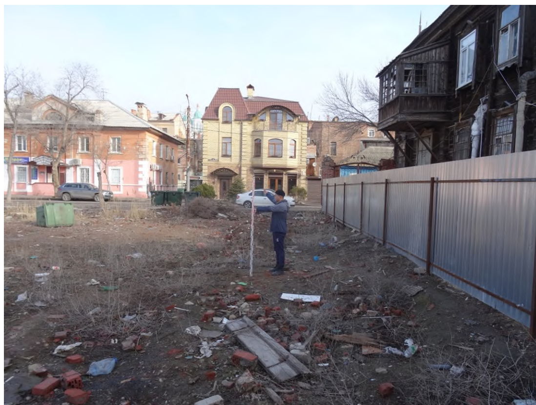
Рис. 9. Ситуация и характер дневной поверхности в восточной части участка с кадастровым номером 30:12:010327:403. Вид с юга.