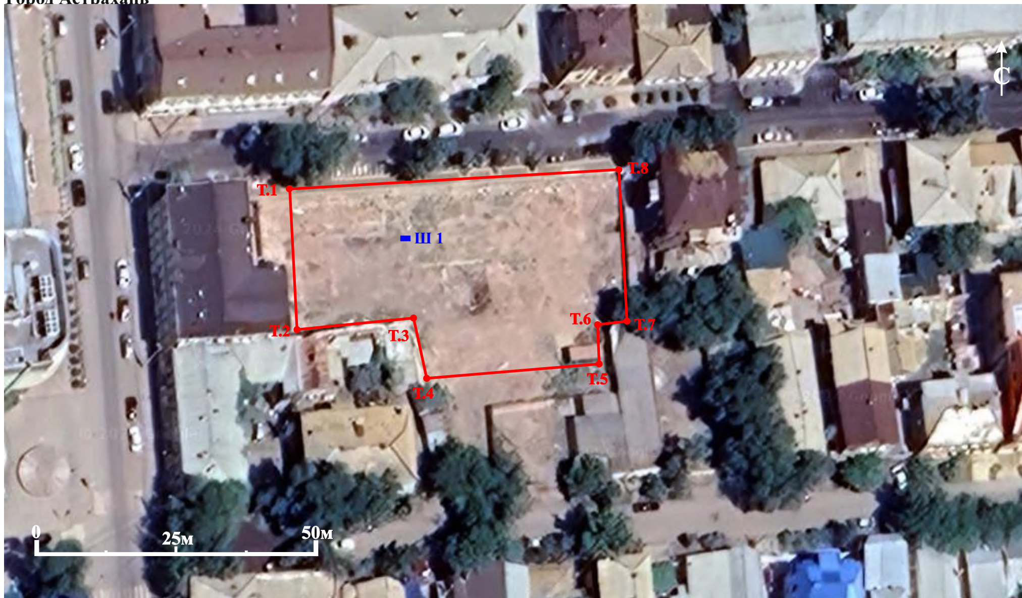
Рис. 5. Снимок со спутника («Bing maps», снимок от 12.07.2021 г.) объекта археологического обследования - участка с кадастровым номером 30:12:010327:403 с указанием его границ, поворотных точек, а также разведочного шурфа.

АЭ - ААН 2024 Астраханская область Город Астрахань