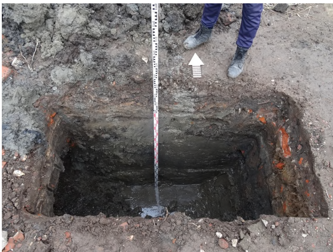
Рис. 13. Контрольный прокоп у северного борта шурфа 1. Вид с юга.