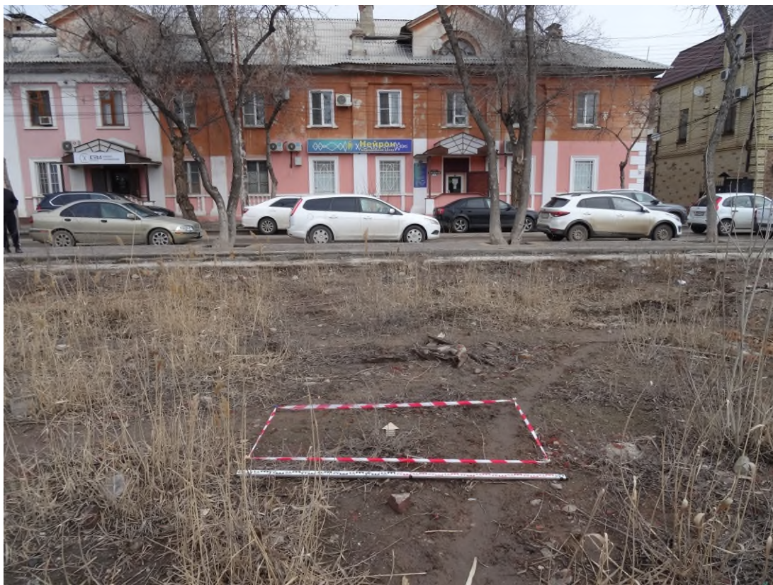
Рис. 10. Раскладка на местности шурфа 1. Вид с юга.