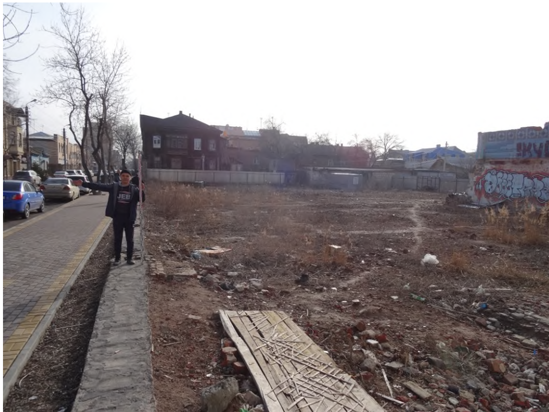
Рис. 6. Ситуация и характер дневной поверхности в северной и западной частях участка с кадастровым номером 30:12:010327:403. Вид с запада.