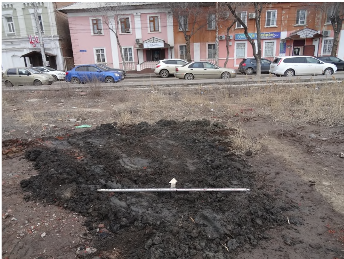
Рис. 14. Шурф 1 на местности после рекультивации. Вид с юга.