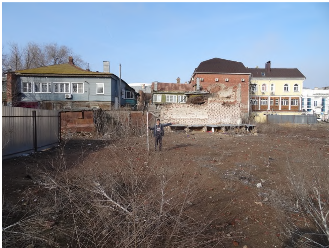
Рис. 8. Ситуация и характер дневной поверхности в южной части участка с кадастровым номером 30:12:010327:403. Вид с востока.