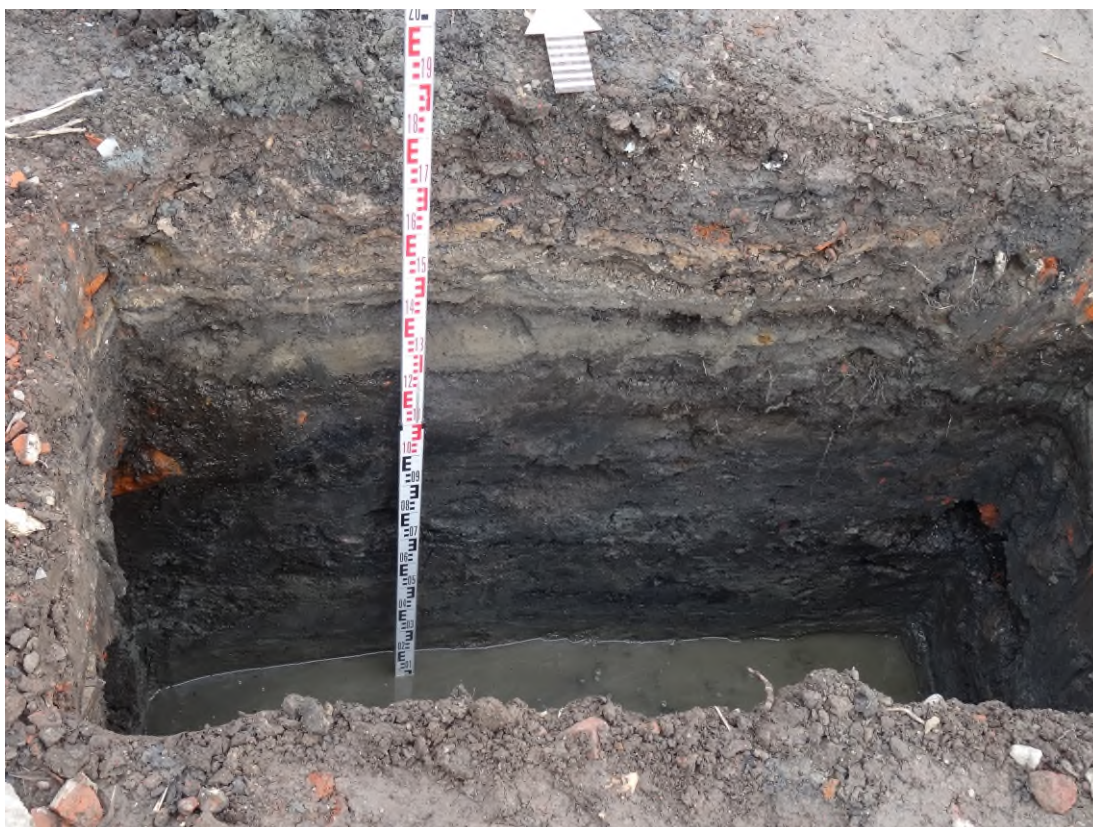
Рис. 12. Профиль северного борта шурфа 1. Вид с юга.

АЭ - ААН 2024 Астраханская область Город Астрахань