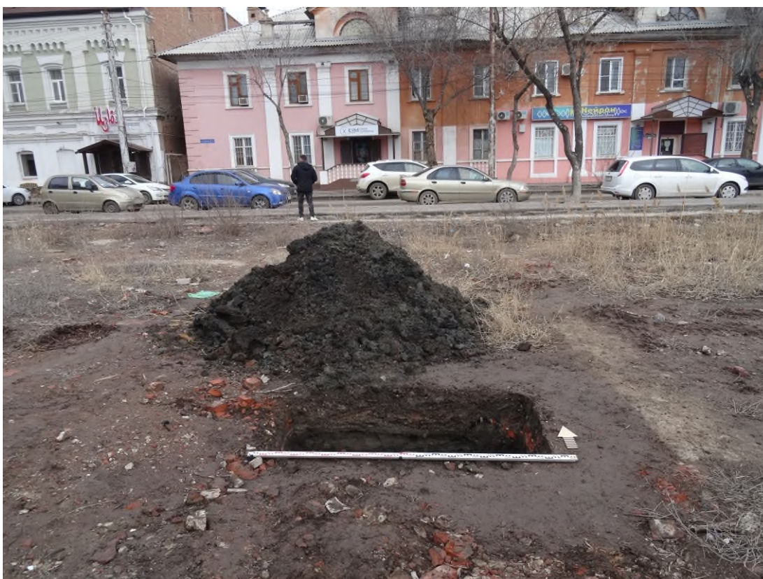
Рис. 11. Шурф 1. Вид с юга.