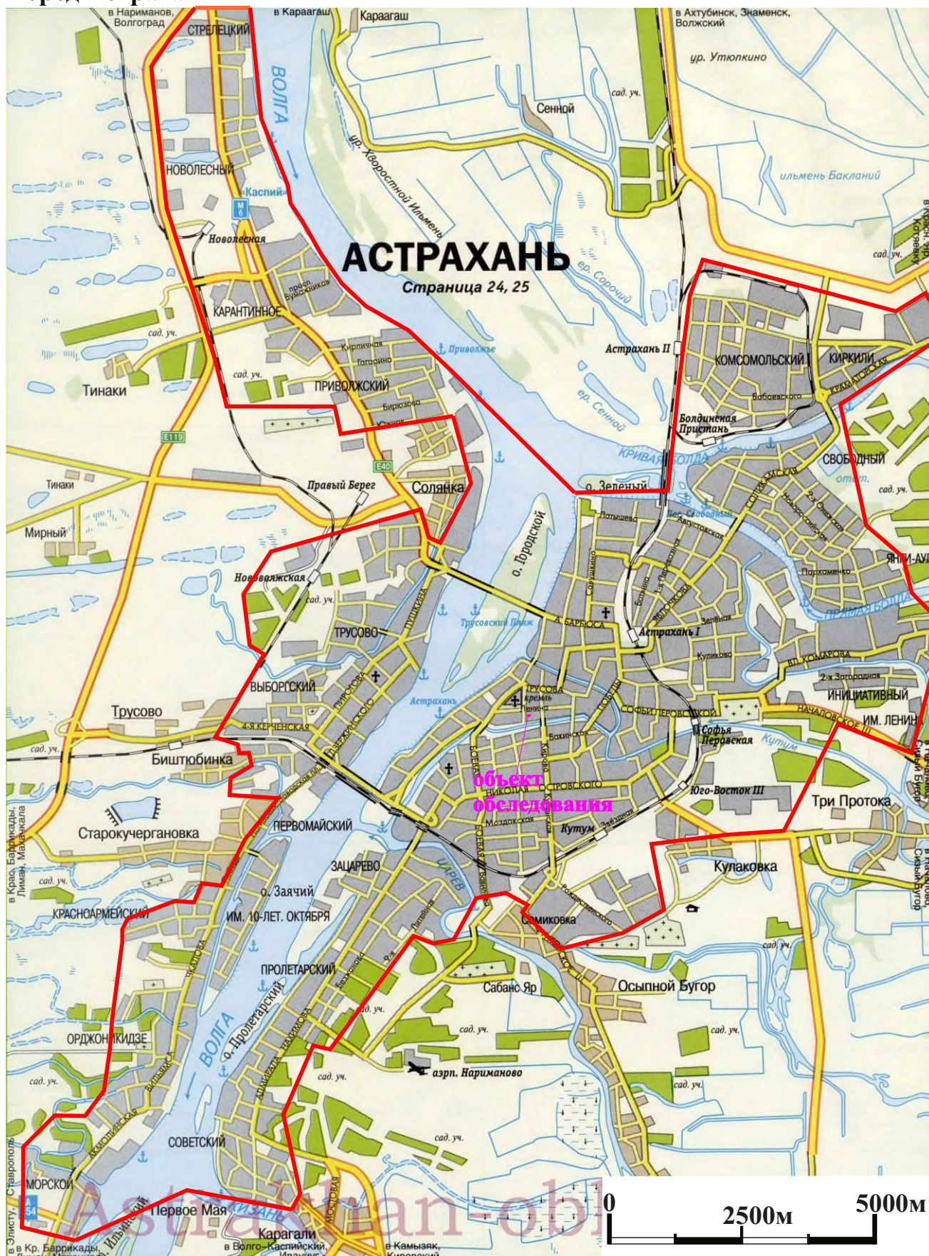
Рис. 1. Карта Астрахани с указанием административных границ и места проведения археологического обследования (разведок).