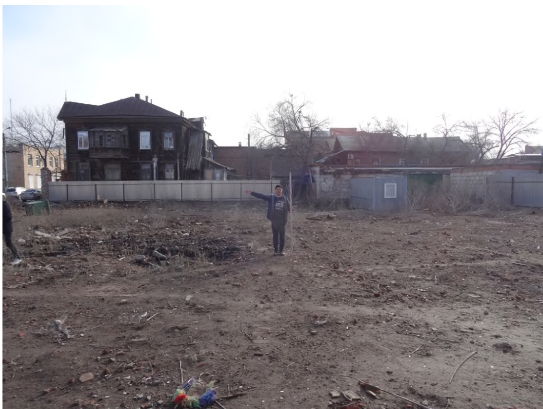
Рис. 7. Ситуация и характер дневной поверхности в центральной части участка с кадастровым номером 30:12:010327:403. Вид с запада.