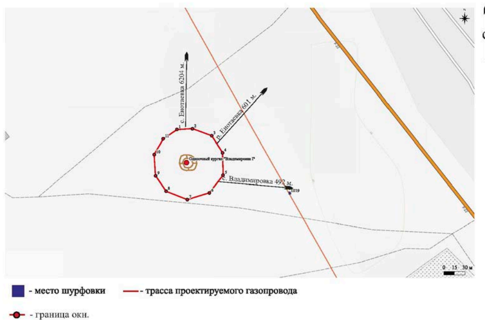
Рис. 8А. План одиночного кургана Владимировка-1 относительно проектируемой трассы газопровода..