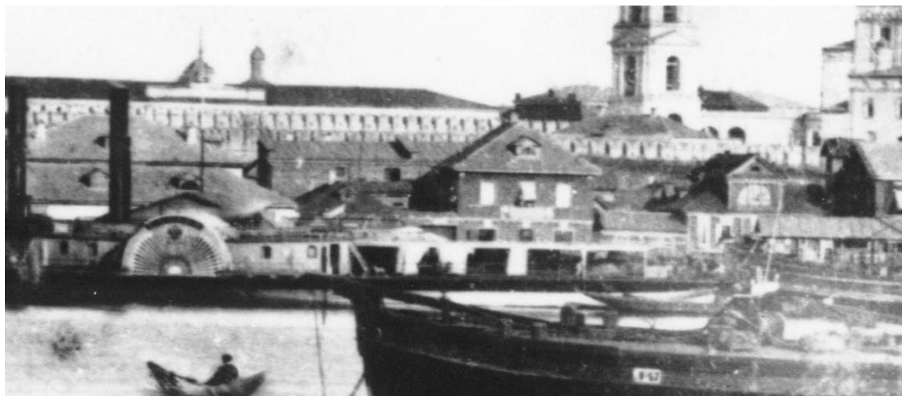
1866 г. В левой части домовладения Аркадьева – одноэтажная кирпичная лавка не более чем в три проема, с высокой кровлей и одним чердачным окном. Далее – прямая балка ворот, правее