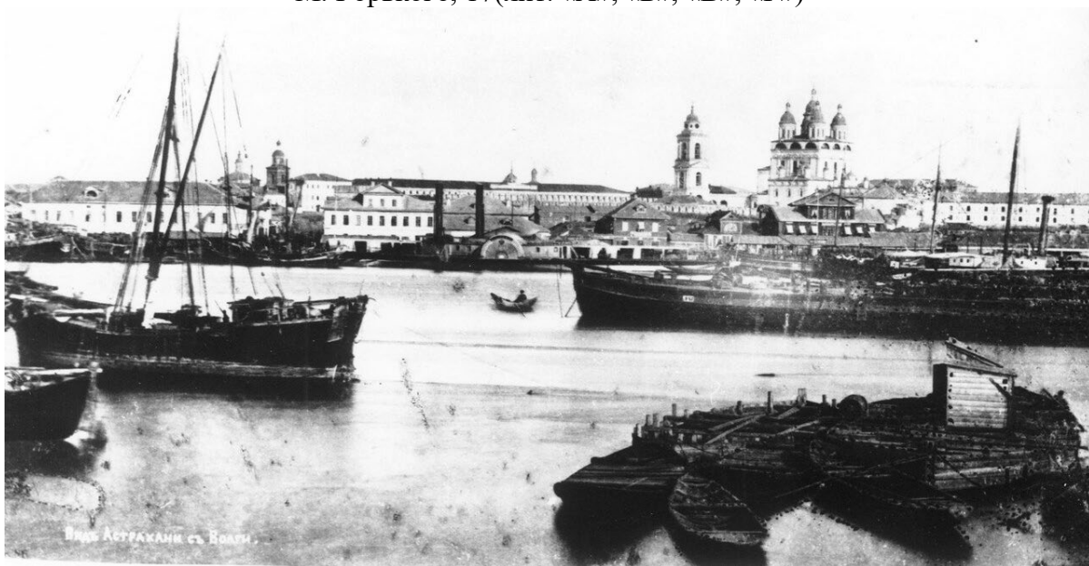
Панорама Астрахани с Волги. 1866 г. Слева направо: дом Артемьевых, ул. Никольская, дом Феофанова с мезонином, дом Жарова (еще одноэтажный), дом Аркадьева, дом Алексеева деревянный с мезонином, дом Степанова двухэтажный с мезонином. Домов Комовых, Артемьевых, Смирнова и Ефимовой не видно.

Материалы иконографии объекта культурного наследия регионального значения «Дом жилой со службами и лавками Аркадьева В., до 1868 г.», расположенного по адресу: г. Астрахань, ул. М. Горького, 17(лит. «А», «Б», «В», «Г»)