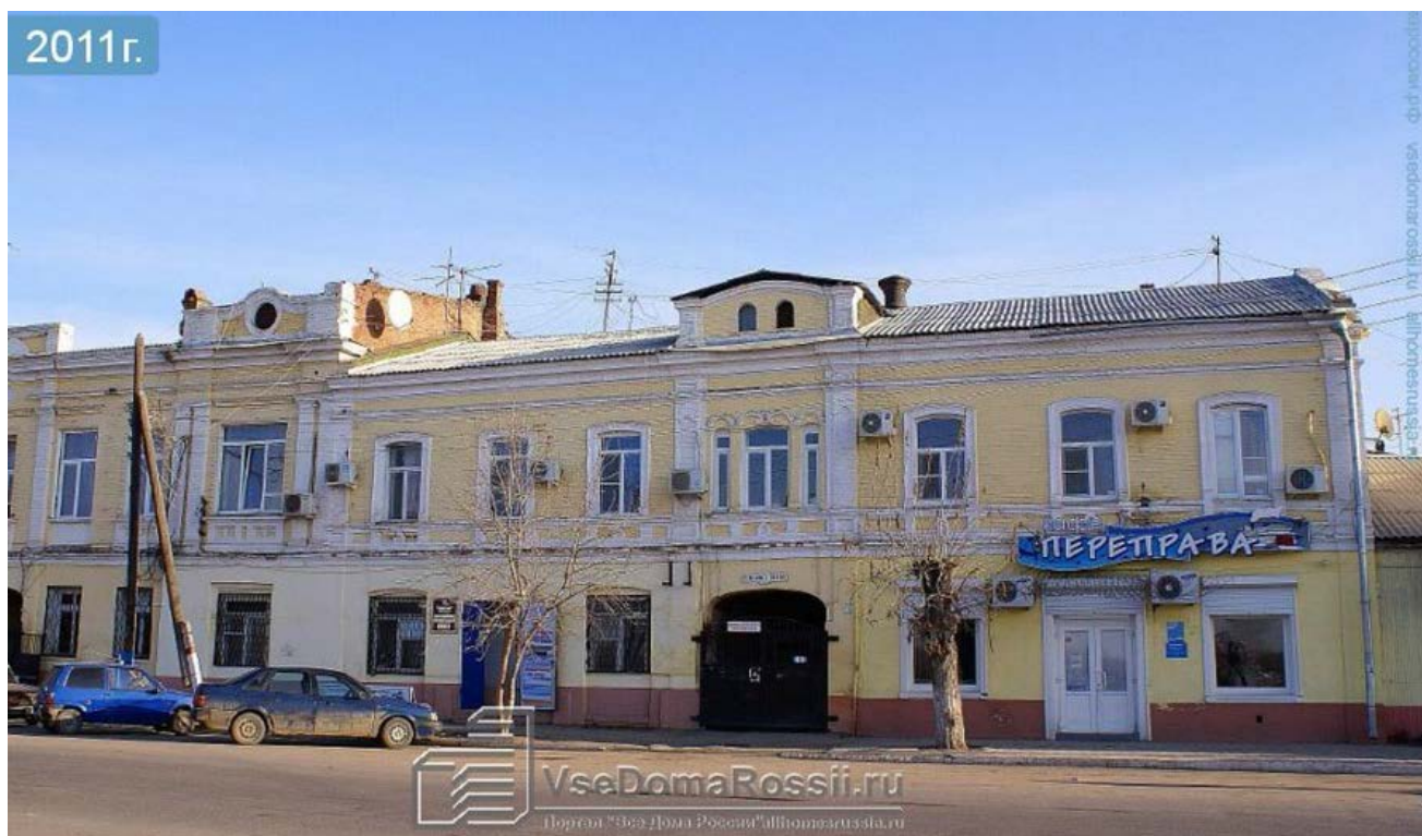
Фото с сайта вседомароссии, 2011 г.