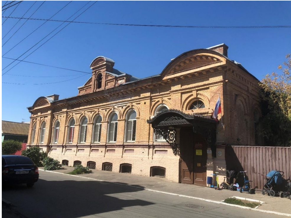
Ф 1. Вид на Объект (Лит. «А») с ул. Епишина.