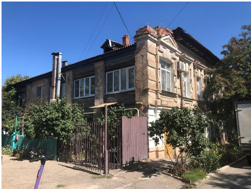
Ф.2. Вид на Объект (Лит. «Б») с ул. Епишина.