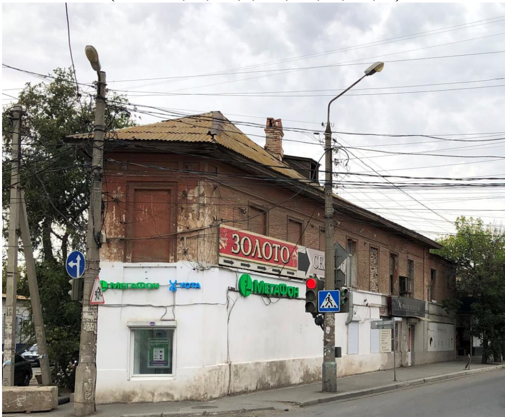
Вид на северо-восточный фасад Объекта по улице Свердлова.