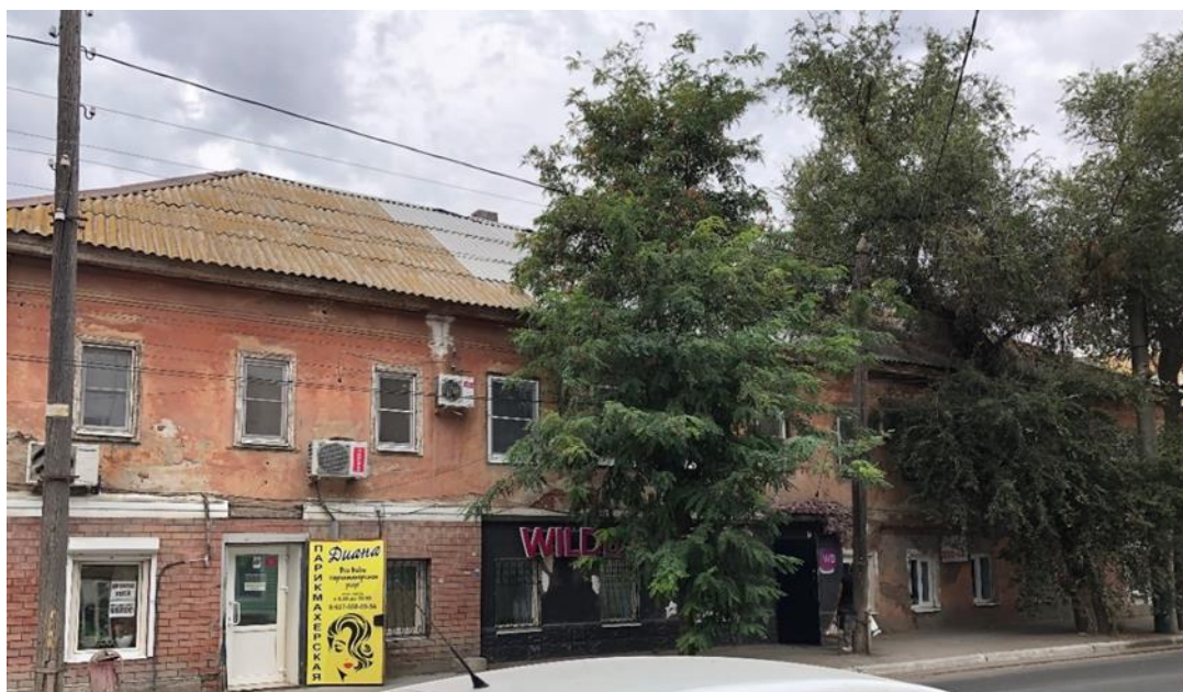
Северный фасад по ул. Свердлова лит. «Б»