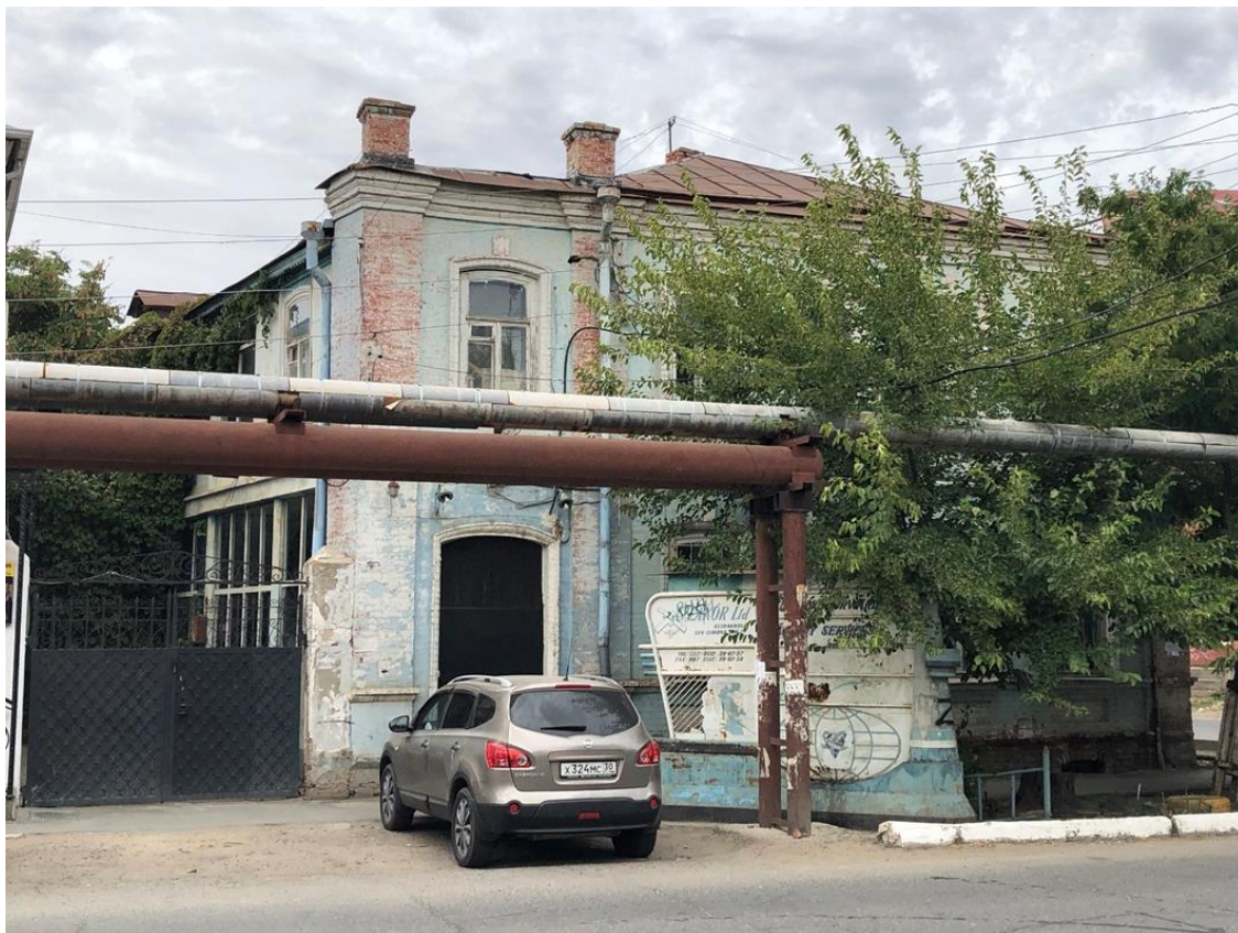
Фото 1. Вид на фасад Объекта с улицы Сен-Симона.