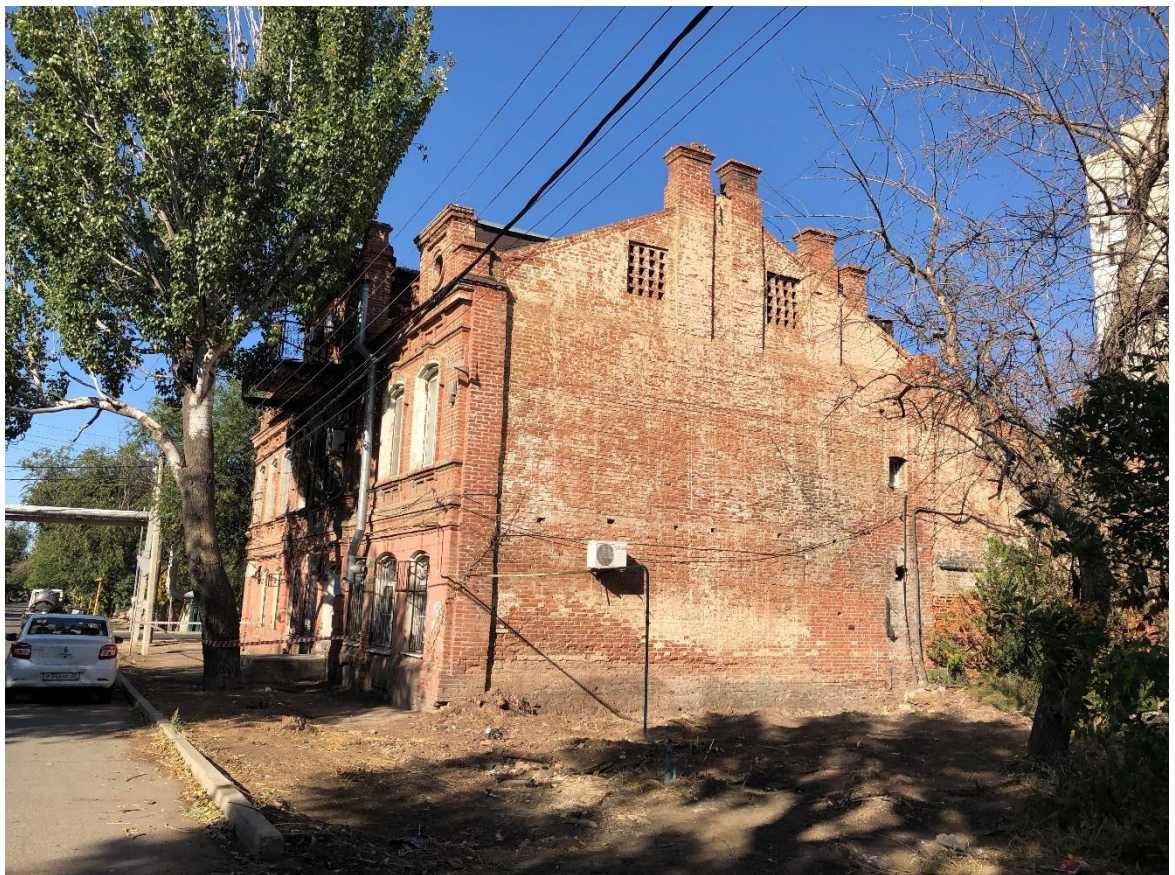
Фото 2. Общий вид на объект с юго-западной стороны.