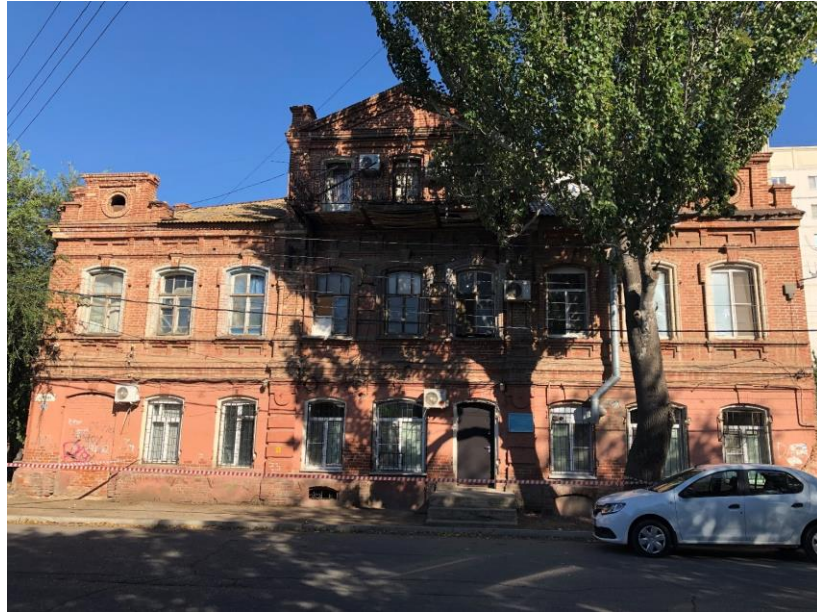
Фото 1. Вид на главный фасад Объекта с западной стороны.