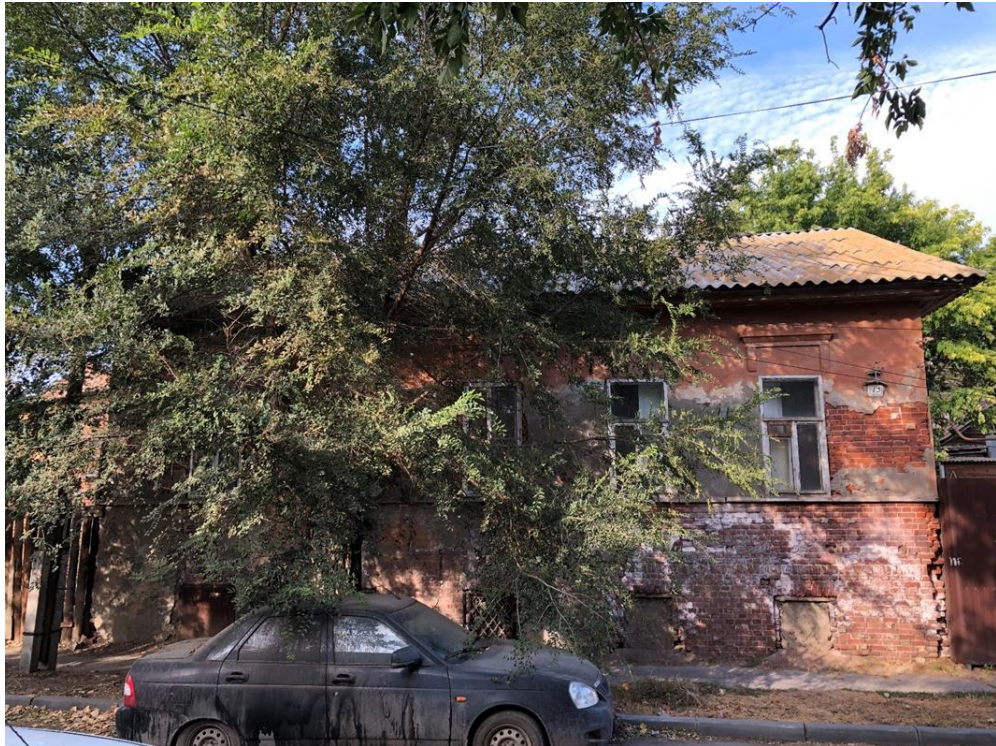
Фото 1. Вид на главный фасад Объекта по улице Бабушкина.