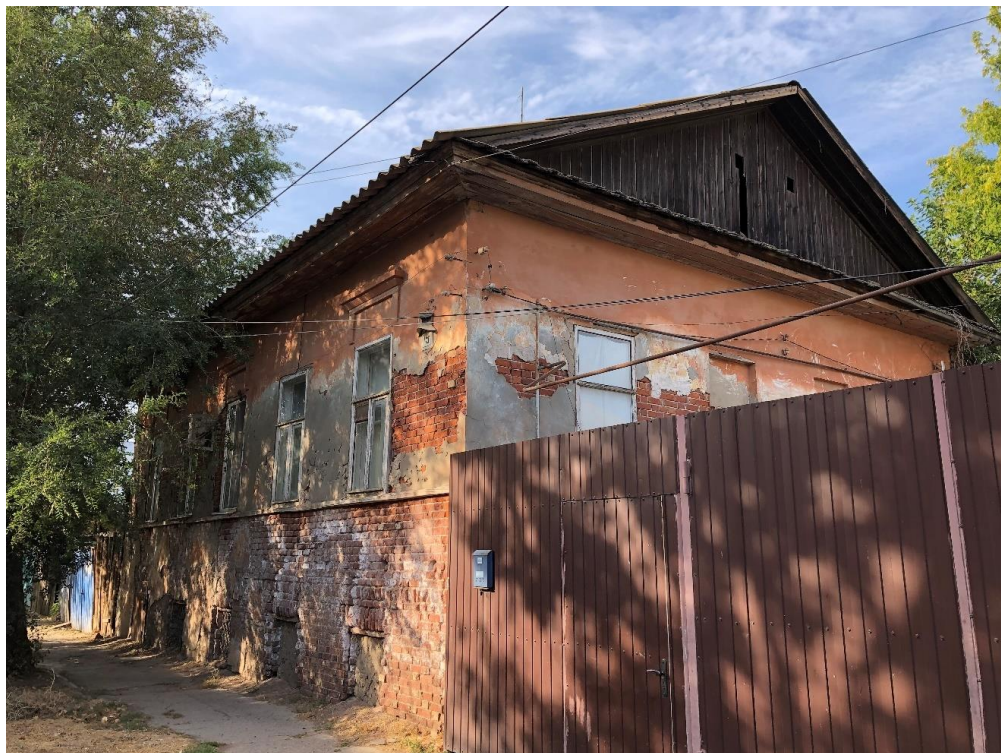
Фото 2. Общий вид на объект по улице Бабушкина.