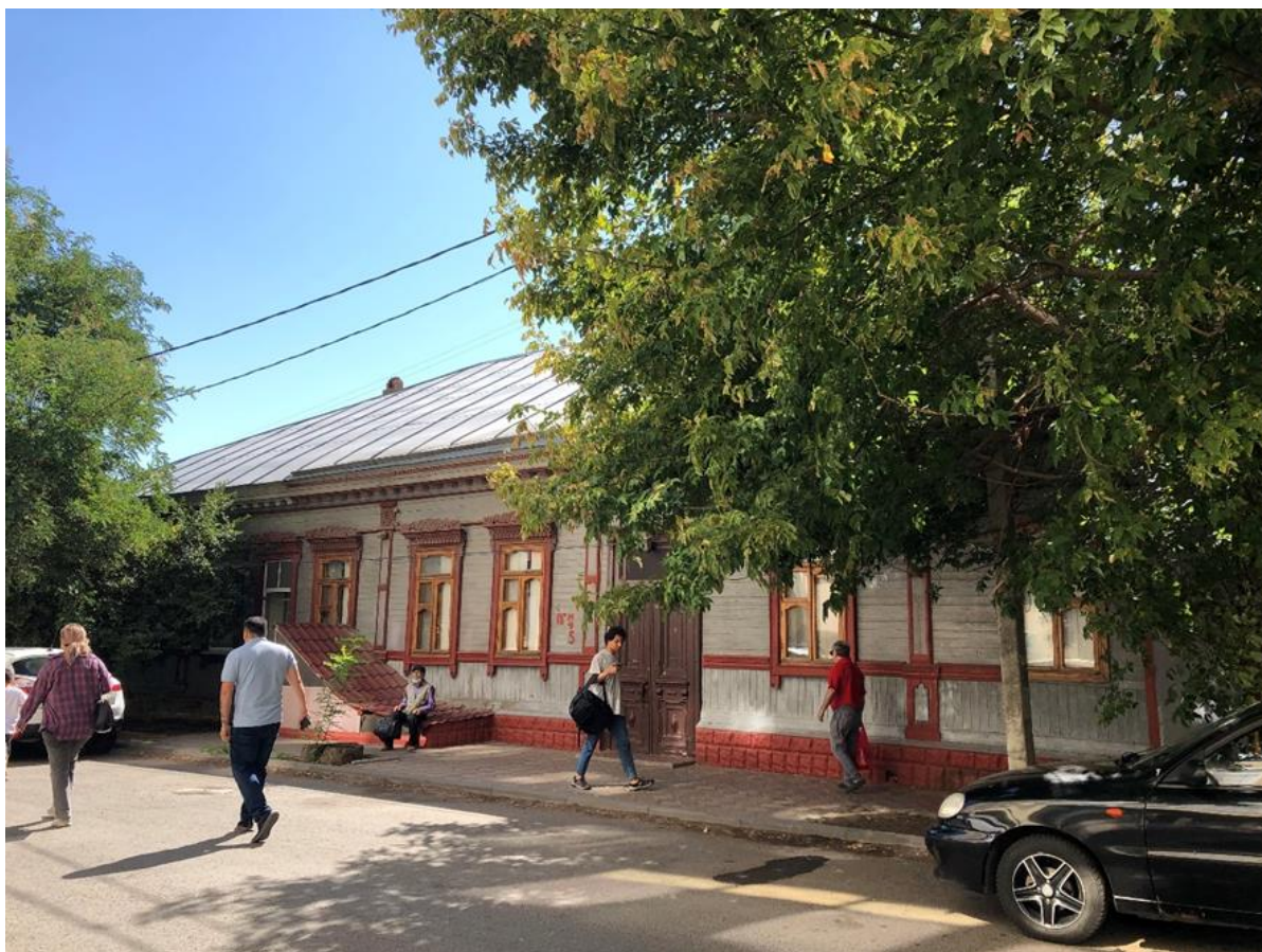
Фото 2. Вид на Объект с улицы Гилянская.