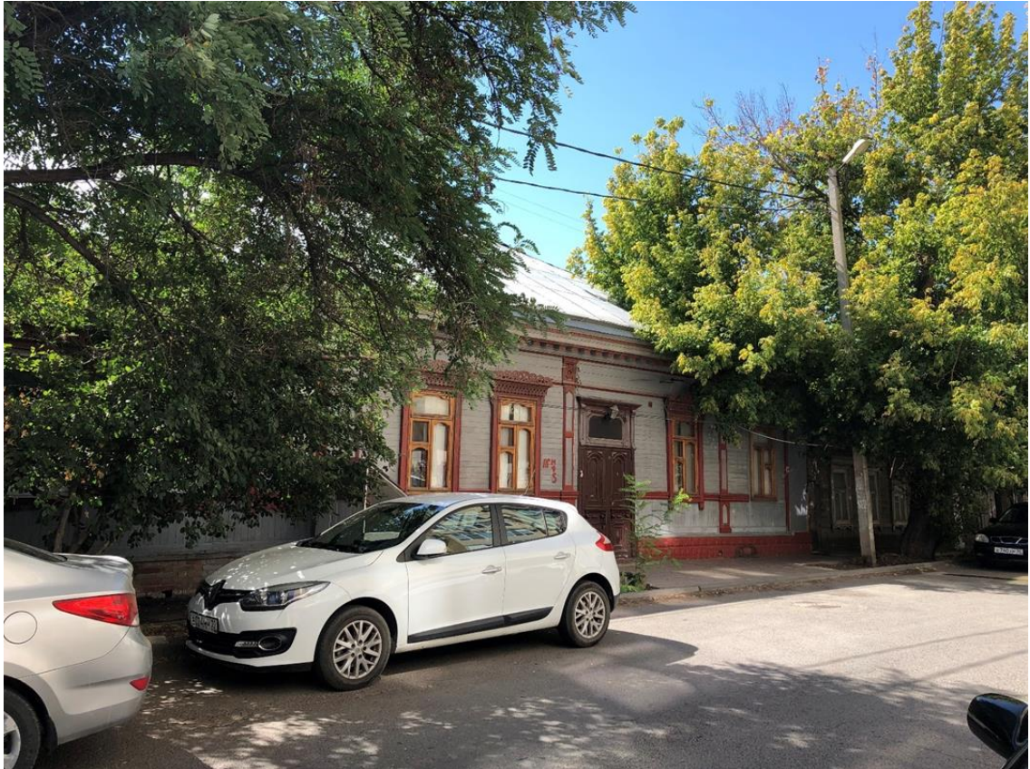
Фото 1. Вид на Объект с улицы Гилянская.