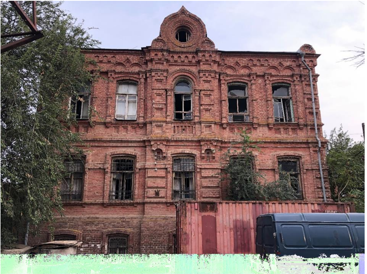
Фото 1. Вид фасад Объекта с улицы Фадеева.