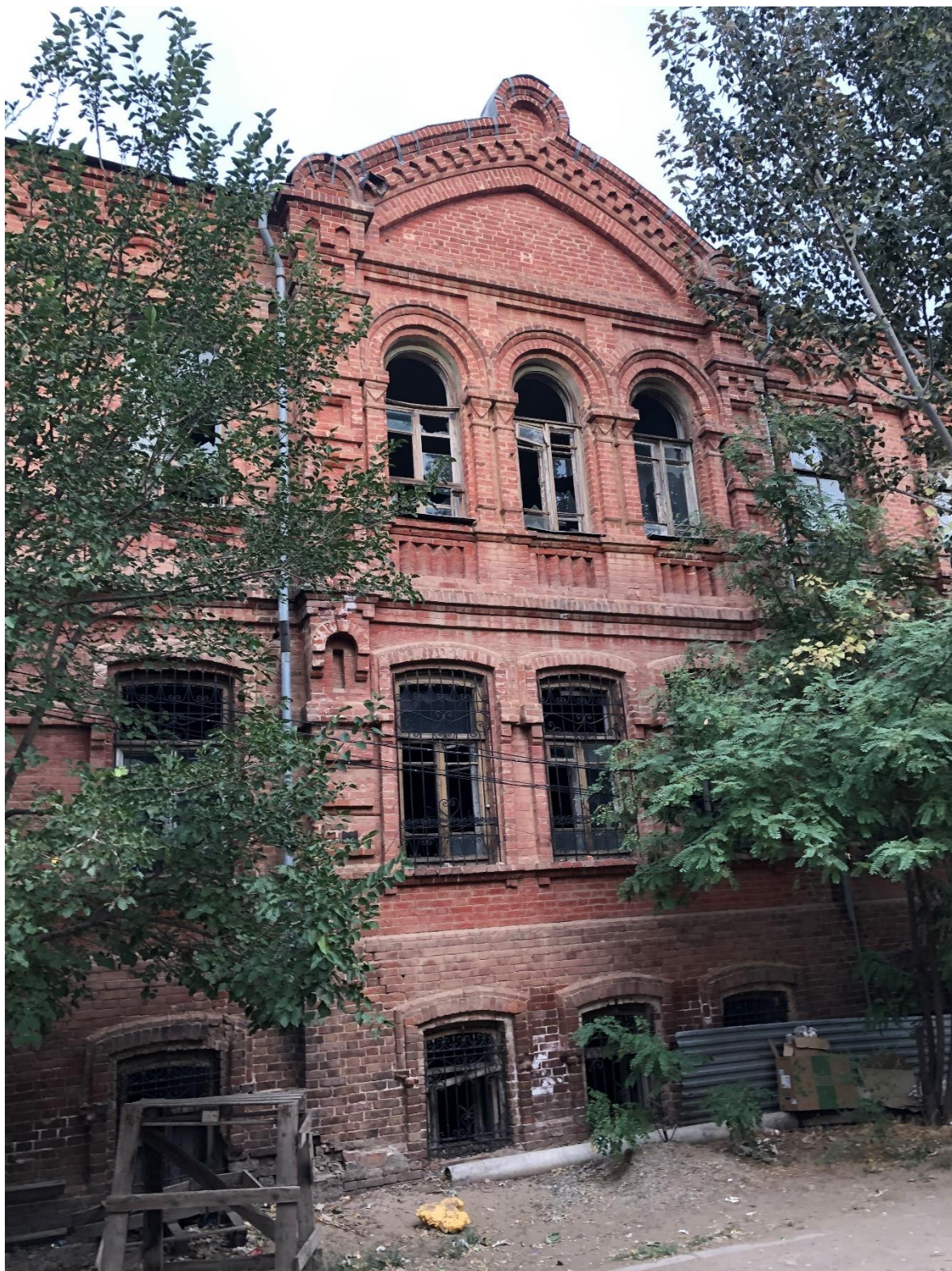
Фото.3. Вид на фрагмент фасада объекта с переулка Пионерский.