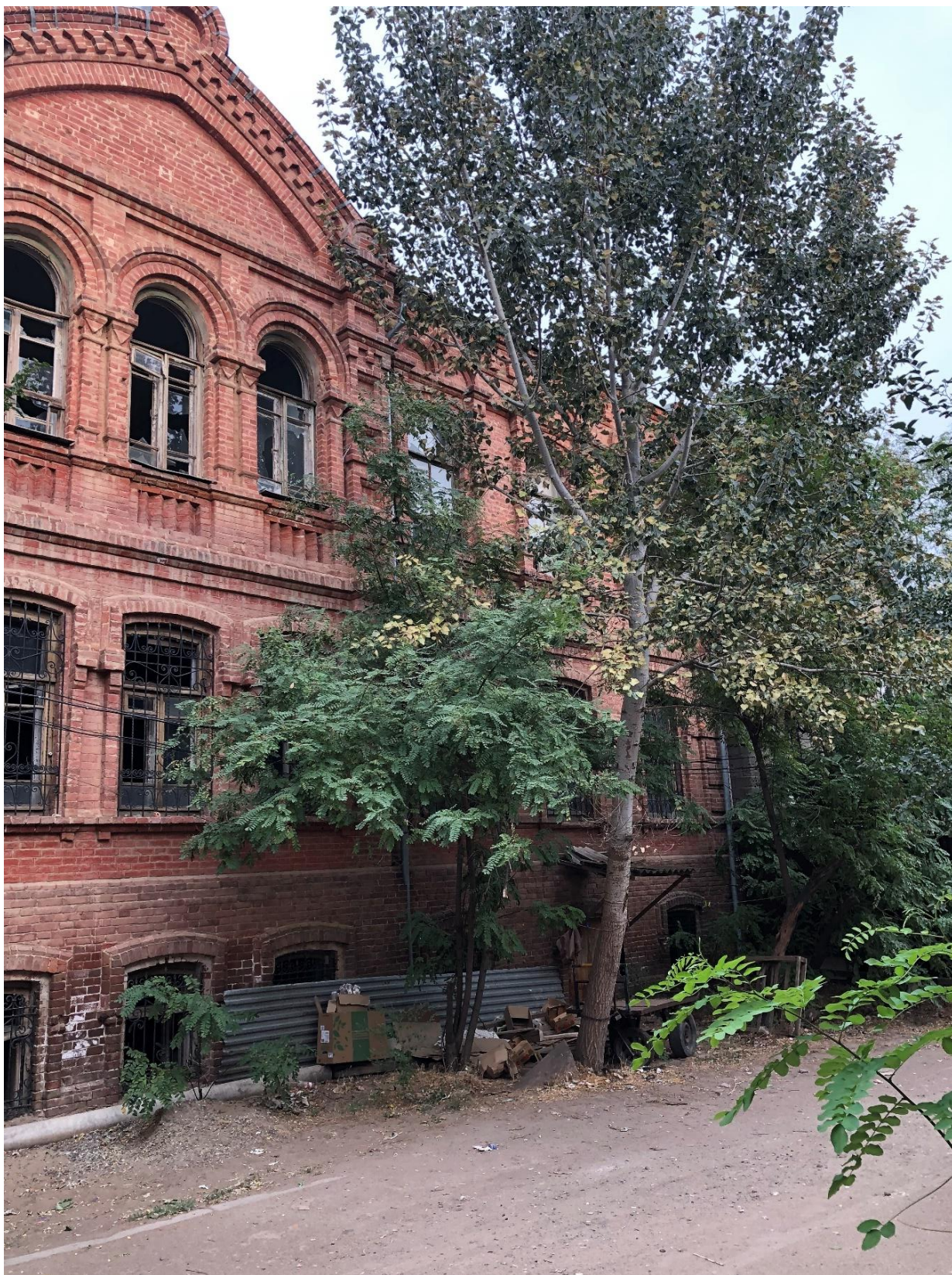
Фото.4. Вид на фрагмент фасада объекта с переулка Пионерский.