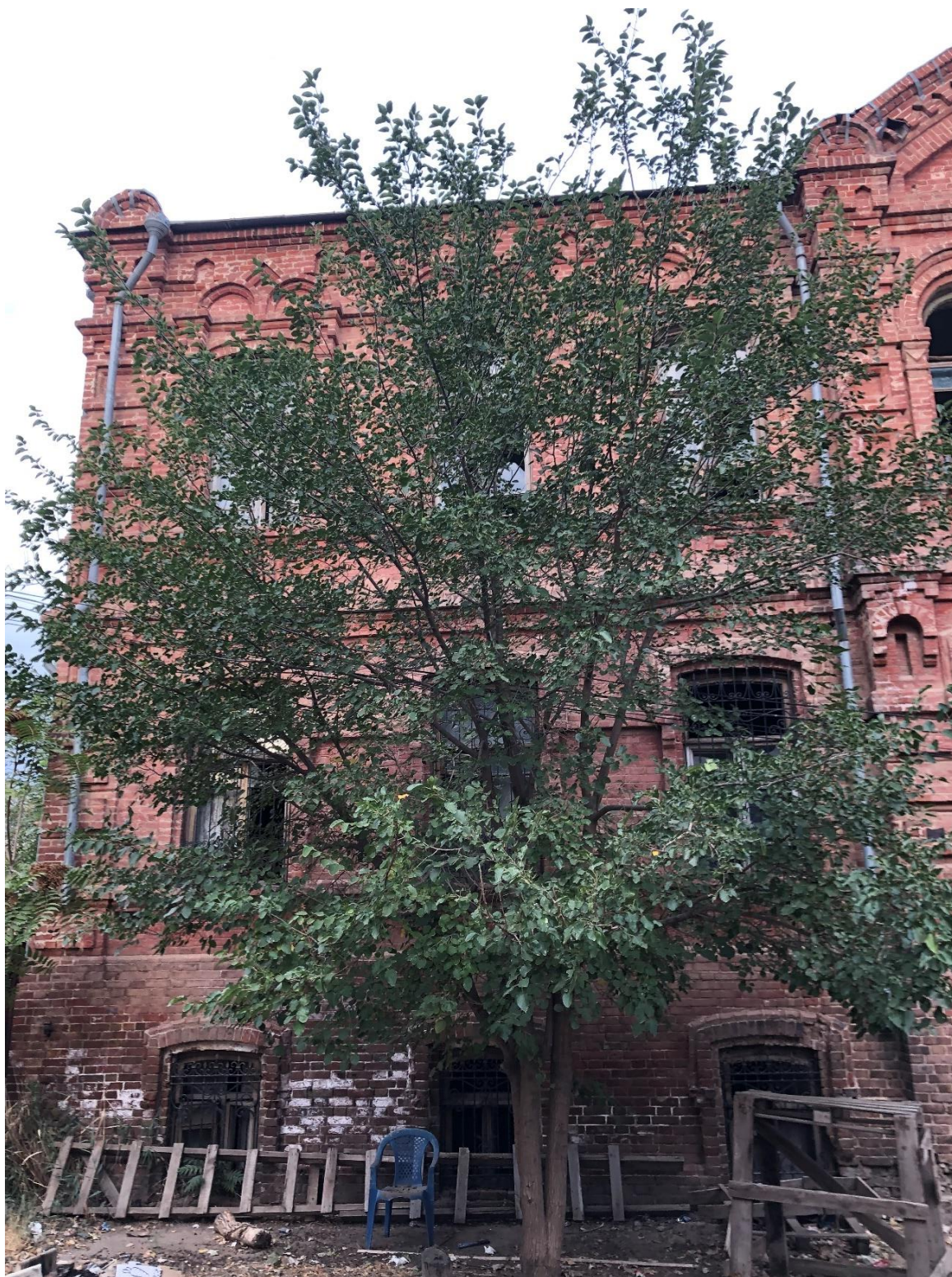
Фото.2. Вид на фрагмент фасада объекта с переулка Пионерский.