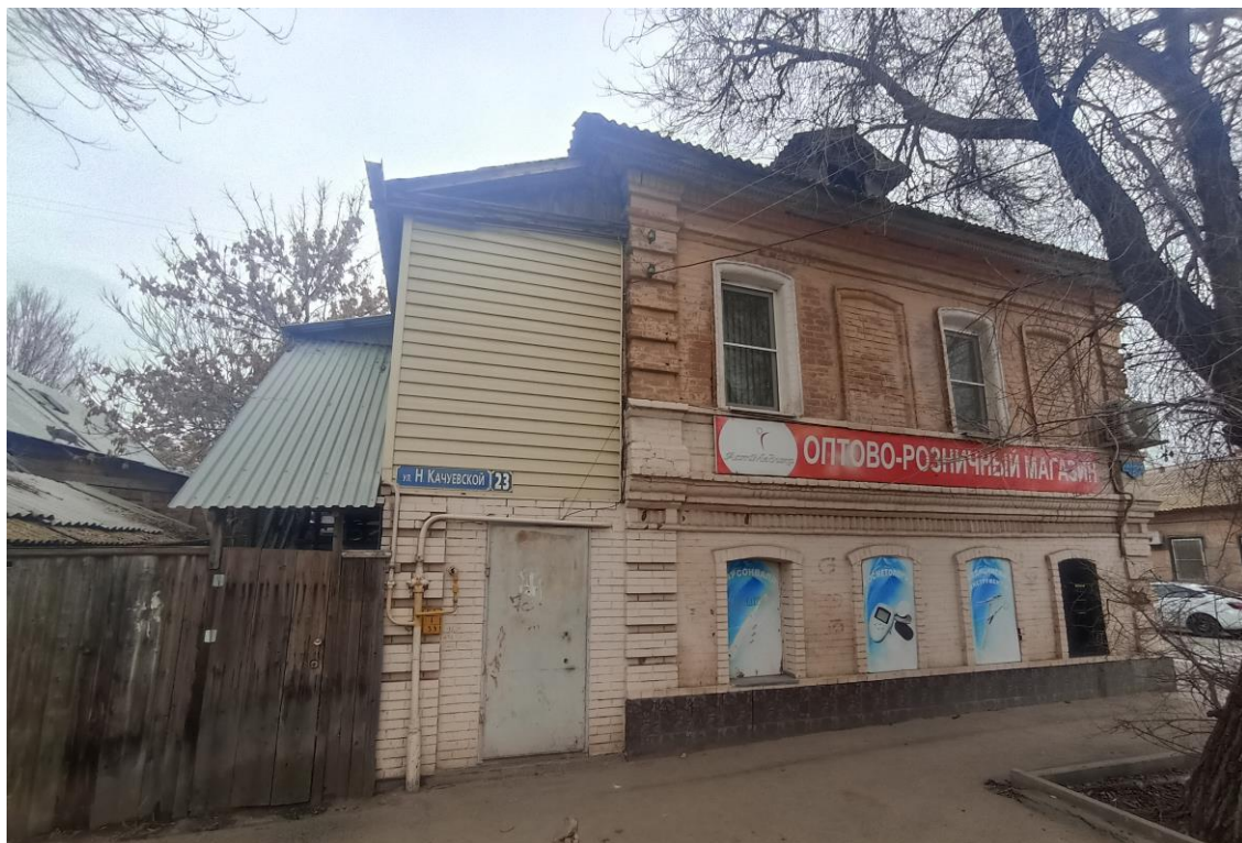
«Усадьба городская», кон. XIX в.— г. Астрахань, ул. Н. Качуевской, 23, ул. Победы, 17. Фото № 3. Главный юго-западный фасад лит. «А» (ул. Н. Качуевской). Фото: Горлов Г.В., февраль 2025 г.