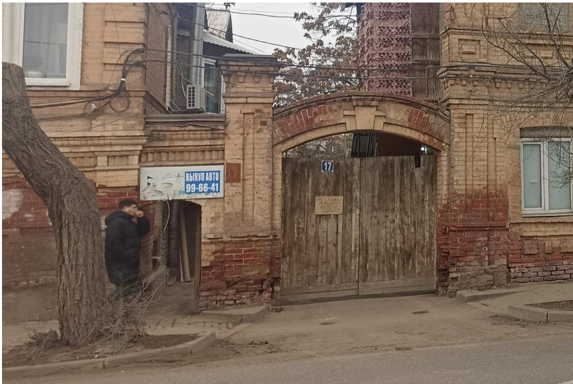
«Дом жилой с лавками», кон. XIX в. – г. Астрахань, ул. М. Горького, 43. Фото № 7. Ворота с калиткой, поставленные между лит. «А» и лит. «Б» (ул. Победы). Фото: Горлов Г.В., февраль 2025 г.