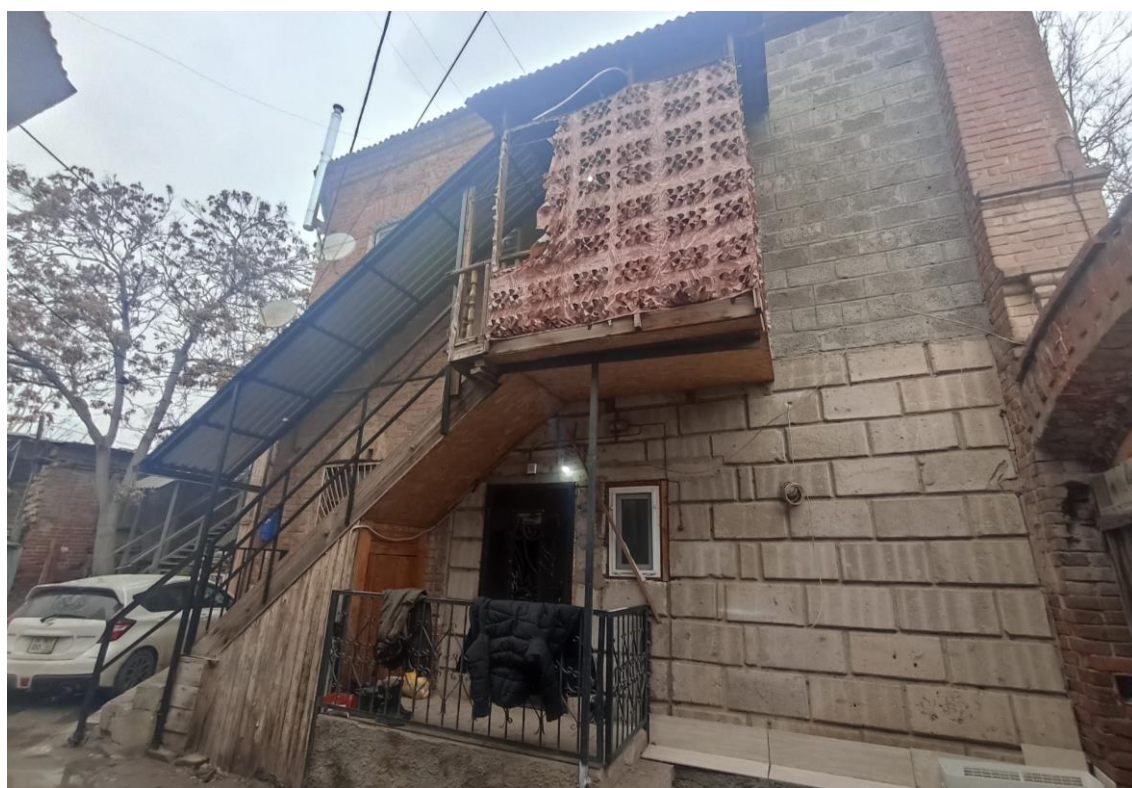
«Дом жилой с лавками», кон. XIX в. — г. Астрахань, ул. М. Горького, 43. Фото № 10. Дворовый юго-западный фасад лит. «Б».