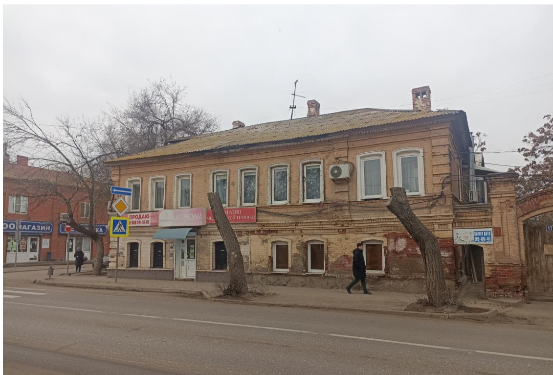
«Усадьба городская», кон. XIX в.— г. Астрахань, ул. Н. Качуевской, 23, ул. Победы, 17. Фото № 4. Главный юго-восточный фасад лит. «А» (ул. Победы). Фото: Горлов Г.В., февраль 2025 г.