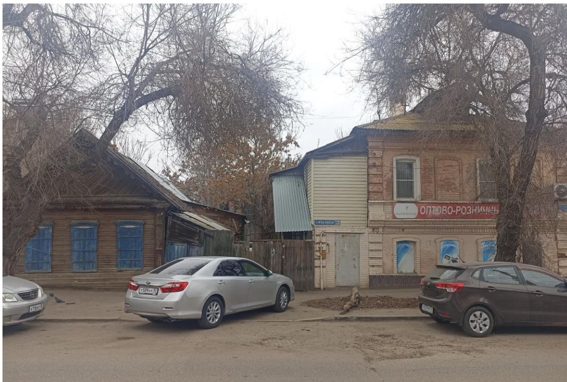
«Усадьба городская», кон. XIX в.– г. Астрахань, ул. Н. Качуевской, 23, ул. Победы, 17. Фото № 1. Вид на юго-западную границу участка Объекта (ул. Н. Качуевской, лит. «В» и лит. «А»)). Фото: Горлов Г.В., февраль 2025 г.