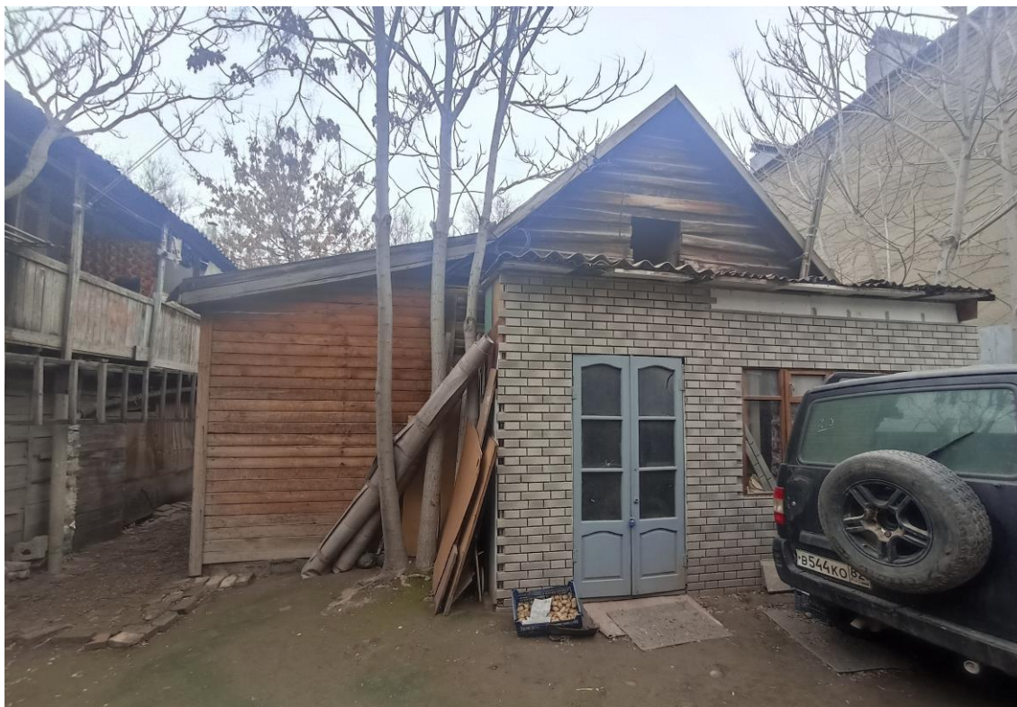
«Дом жилой с лавками», кон. XIX в. – г. Астрахань, ул. М. Горького, 43. Фото № 12. Дворовый северо-восточный фасад лит. «В». Фото: Горлов Г.В., февраль 2025 г.