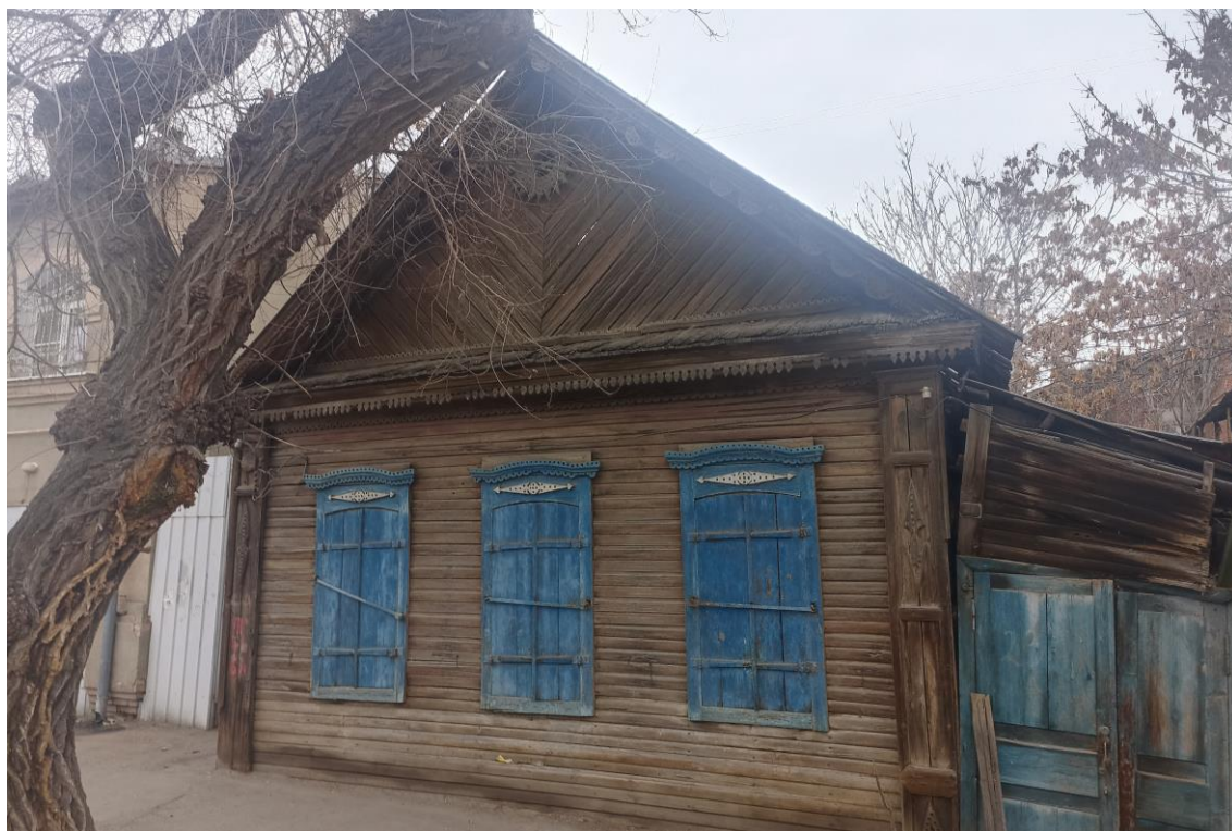
«Усадьба городская», кон. XIX в.– г. Астрахань, ул. Н. Качуевской, 23, ул. Победы, 17. Фото № 2. Главный юго-западный фасад лит. «В» (ул. Н. Качуевской). Фото: Горлов Г.В., февраль 2025 г.