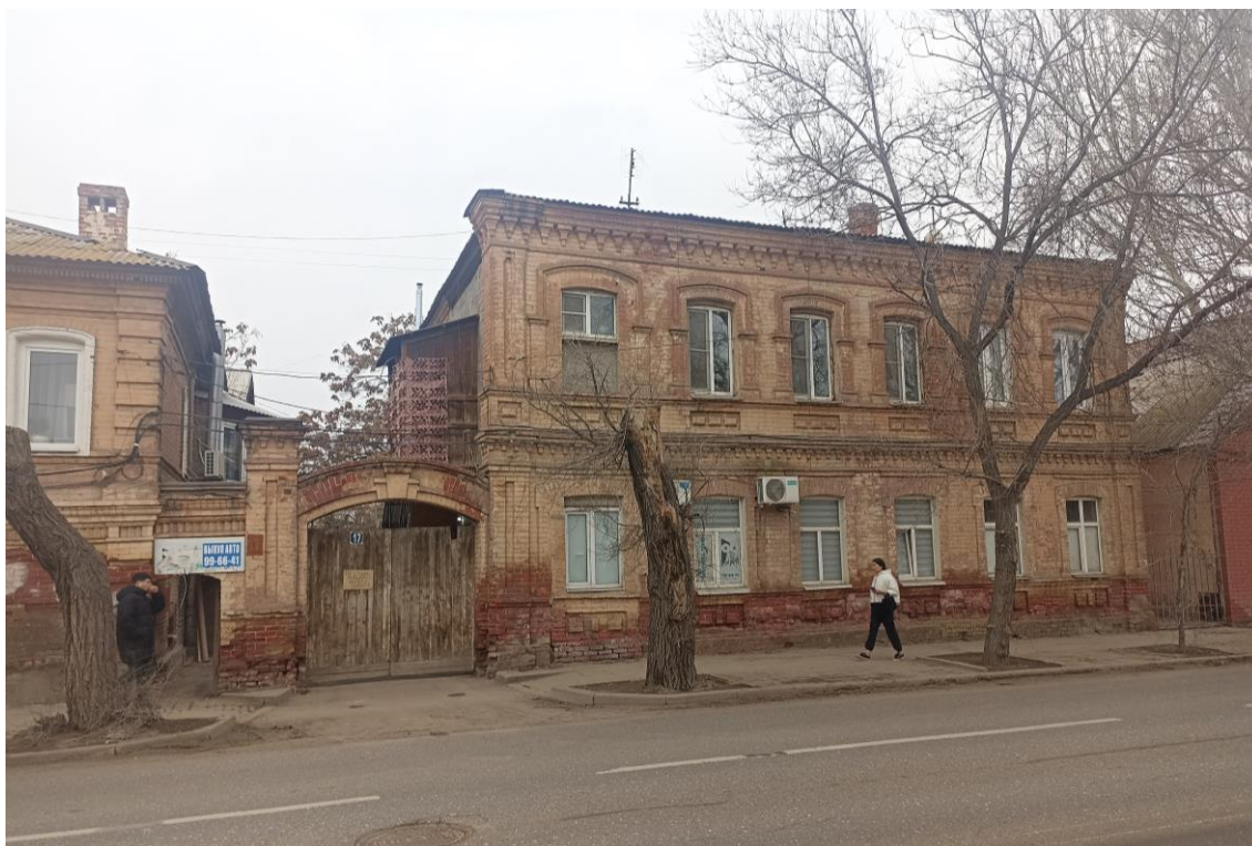
«Усадьба городская», кон. XIX в.– г. Астрахань, ул. Н. Качуевской, 23, ул. Победы, 17. Фото № 6. Главный юго-восточный фасад лит. «Б» (ул. Победы). Фото: Горлов Г.В., февраль 2025 г.