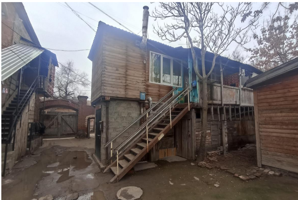
«Дом жилой с лавками», кон. XIX в. — г. Астрахань, ул. М. Горького, 43. Фото № 9. Вид на дворовый северо-западный фасад лит. «А». Фото: Горлов Г.В., февраль 2025 г.