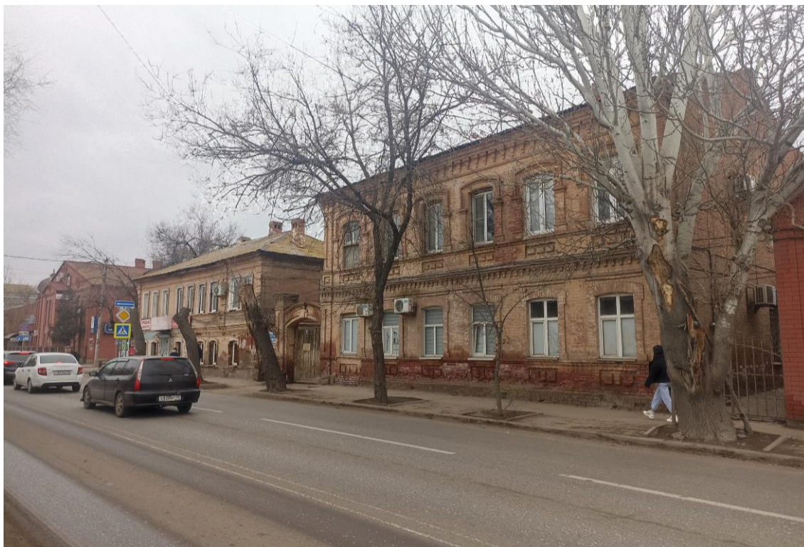
«Усадьба городская», кон. XIX в.– г. Астрахань, ул. Н. Качуевской, 23, ул. Победы, 17. Фото № 5. Вид на юго-восточную границу участка Объекта (ул. Победы, лит. «А» и лит. «Б»)). Фото: Горлов Г.В., февраль 2025 г.