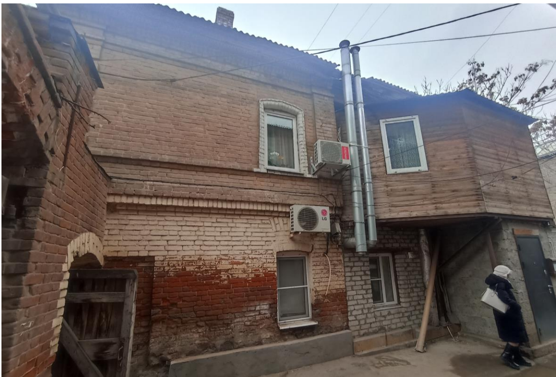
«Дом жилой с лавками», кон. XIX в. – г. Астрахань, ул. М. Горького, 43. Фото № 8. Дворовый северо-восточный фасад лит. «А». Фото: Горлов Г.В., февраль 2025 г.