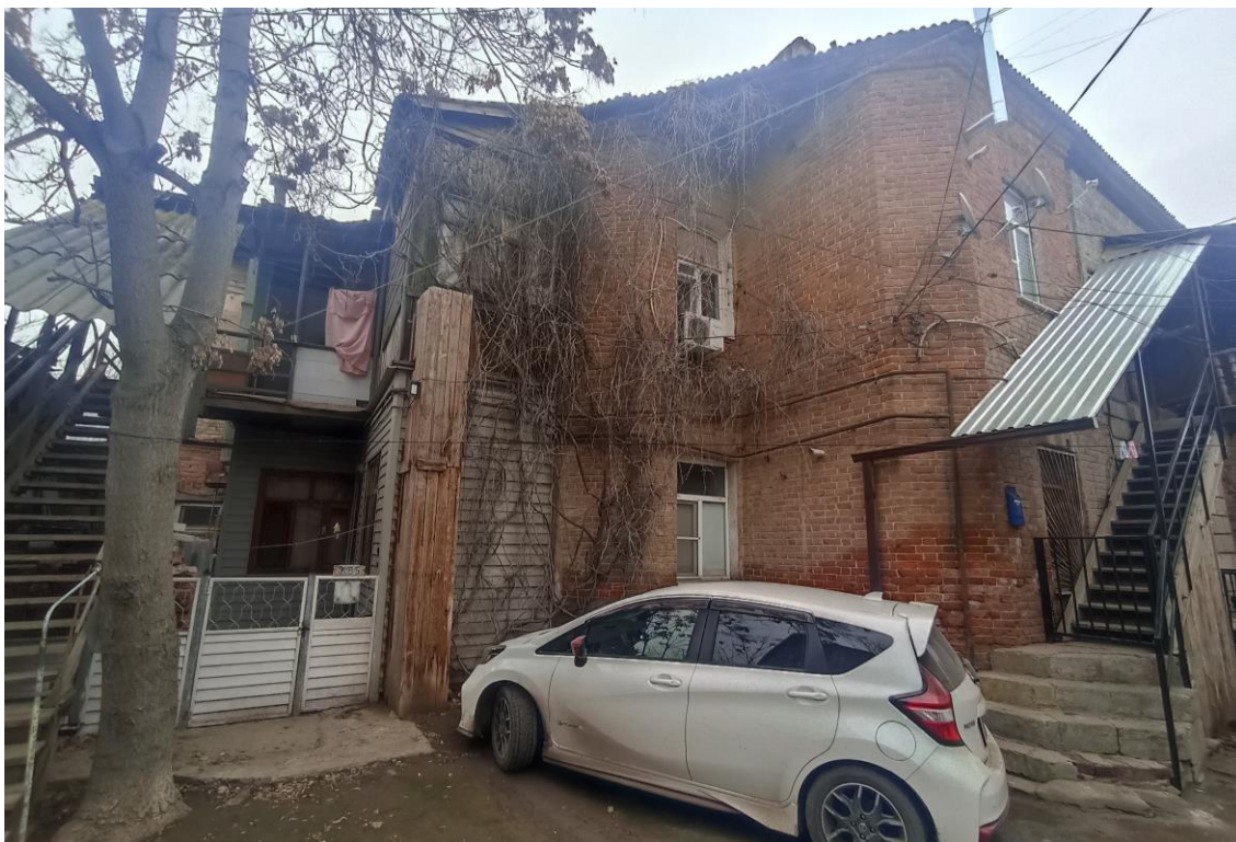
«Дом жилой с лавками», кон. XIX в. – г. Астрахань, ул. М. Горького, 43. Фото № 11. Вид с запада на дворовые фасады лит. «Б». Фото: Горлов Г.В., февраль 2025 г.