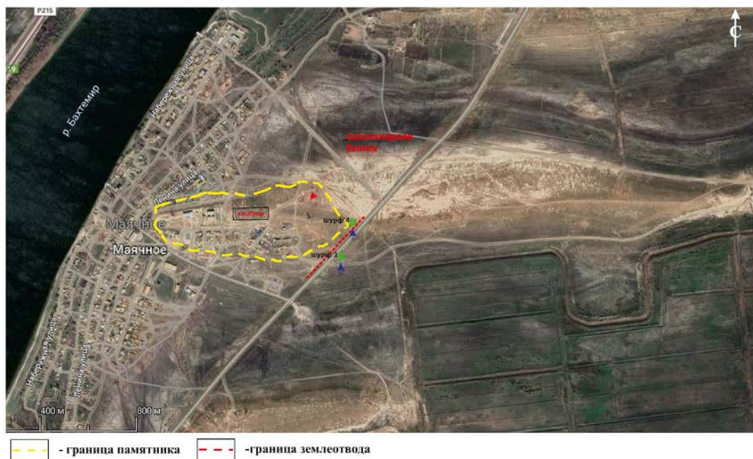
Рис 21. Снимок со спутника окраины с. Маячное Икрянинского района Астраханской области с указанием границы территории памятника археологии - поселения «Большое Маячное».

АНО «НИЦ «Археотерра» 2025 Астраханская область Икрянинский район