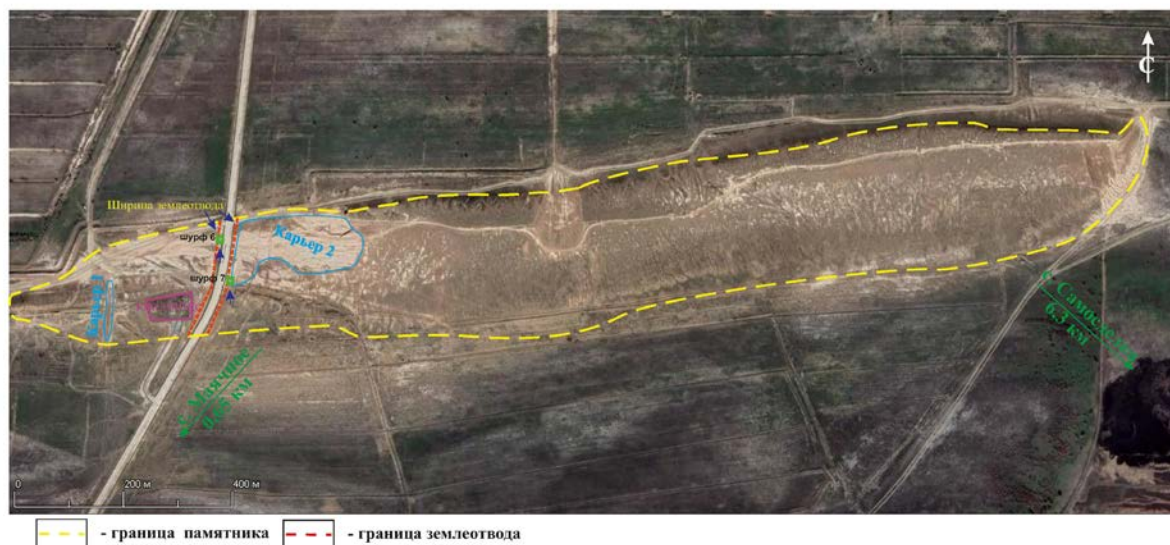
Рис. 34 Снимок со спутника (Google maps) боровского бугра Попок с указанием границы территории памятника археологии - одноименного грунтового могильника и старых карьеров выборки грунта. С отметкой проходящей трассы через памятник.

АНО «НИЦ «Археотерра» 2025 Астраханская область Икрянинский район