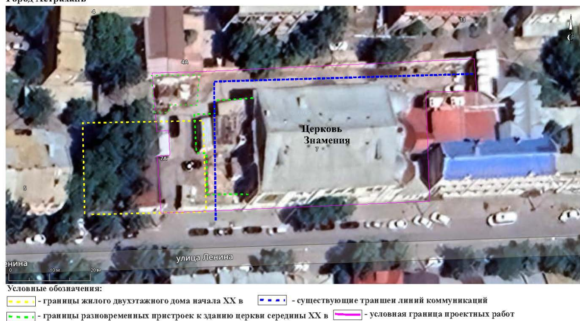
Рис. 7. Спутниковый снимок «ESRI ArkGIS.Imagery» (сборка от 02.12.2020.) места расположения церкви Знамения - объекта ремонтно - реставрационных работ под современное использование, с указанием расположения на обследуемом участке жилого дома, пристроек разных лет и существующих траншей линий коммуникаций.

АЭ - ААН 2025 Астраханская область Город Астрахань