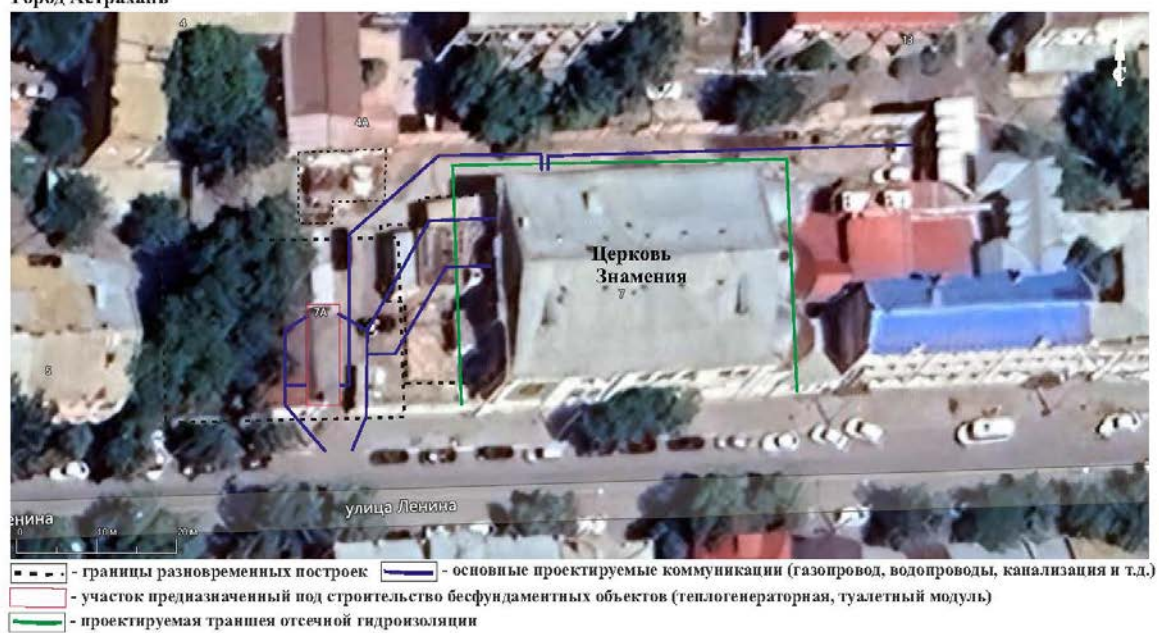
Рис. 9. Спутниковый снимок «ESRI ArkGIS.Imagery» (сборка от 02.12.2020.) места расположения церкви Знамения - объекта ремонтно - реставрационных работ под современное использование, с указанием расположения проектируемых объектов в границах проектных работ.

АЭ - ААН 2025 Астраханская область Город Астрахань