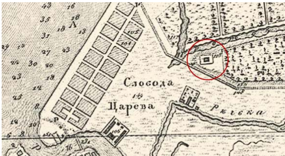
Фрагмент плана г. Астрахани 1820 г. №118 - «Пороховой погреб»

В 1903 г. в Городскую Думу была представлена справка о том, что городская земля в 6 полицейском участке значится записанной по инвентарю временно отчуждённой под постройки пороховых погребов в количестве 2300 кв. сажень неизвестно с какого времени.